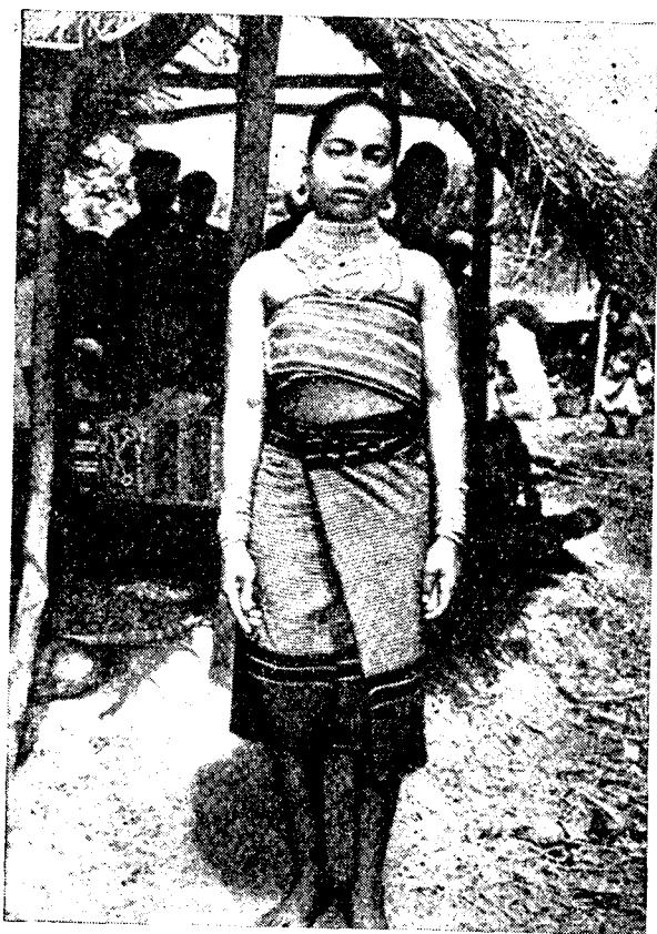
Девушка типера в национальной одежде

Вместе с тем уже происходит социальное расслоение, выделяется зажиточная часть населения.