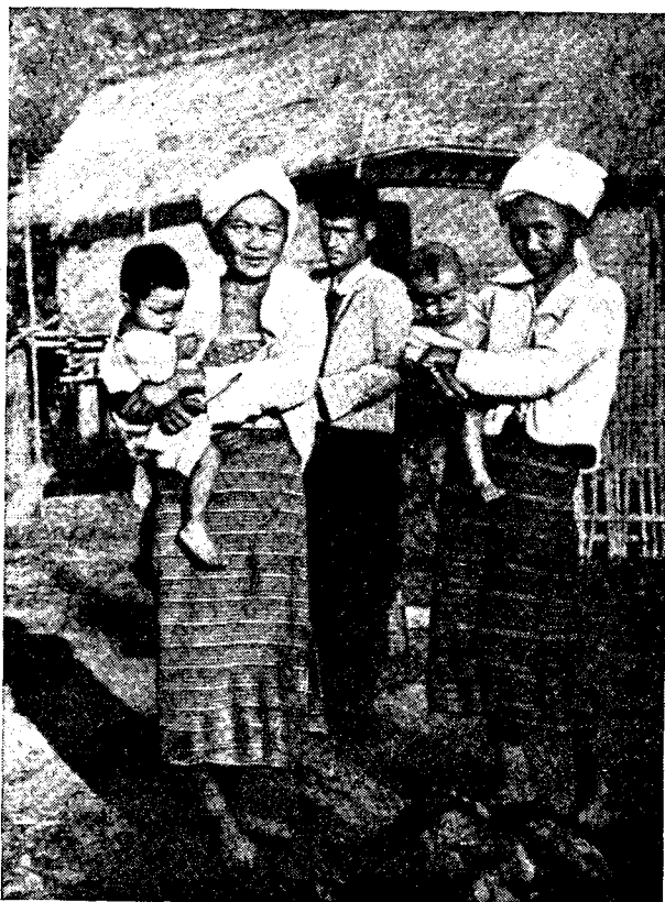
Семья марма из Бандарбана

В материальной и духовной культуре чакма и марма мало различий. У тех и других дома каркасно-столбовые, опорные столбы высокие, так что пол значительно приподнят над землей, стены сделаны из бамбука, крыша кроется соломой или сухой травой. Прямоугольный в плане дом обычно состоит из двух-трех помещений, которые снабжены окнами со