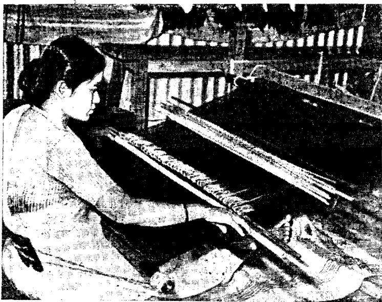
Женщина чакма за ручным ткацким станком

Чакма и марма исповедуют буддизм тхеровадского толка 6 . Несмотря на длительные контакты этих народов с бенгальцами, влияние на них ислама и индуизма почти не прослеживается. У марма в особенности сильны пережитки добуддийских народных верований. Наиболее устойчивы они в родильных, свадебных и похоронных обрядах. Широко рас-