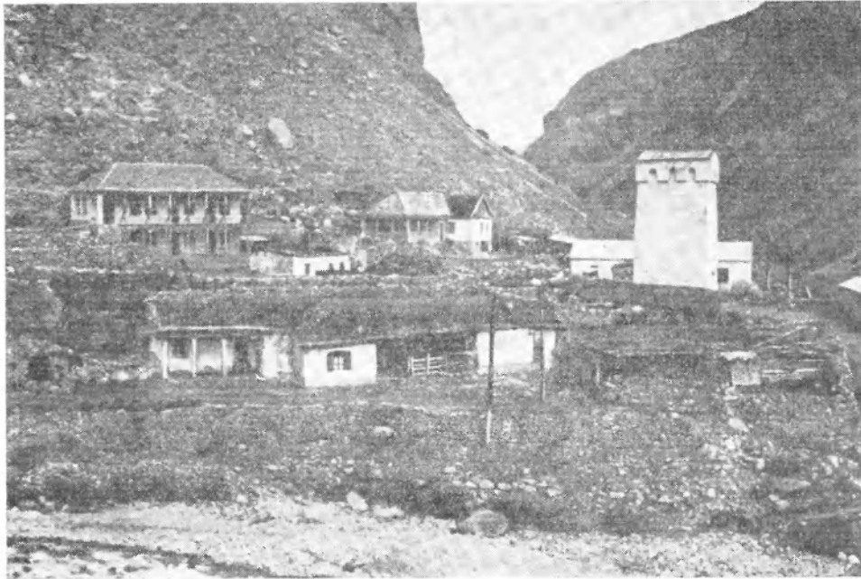
Рис. 2. Сванская башня в сел. Верхний Чегем

к новой семье. Наконец, проклятие «чтобы у тебя в очаге погас огонь» говорит о том значении, которое придавалось очагу.