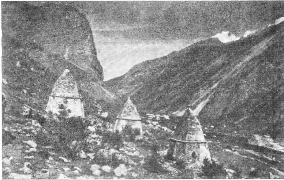
Рис. 3. Надземные склепы в сел. Верхний Чегем

вы и туры рога. Можно полагать, что культура пива, принесенная на Северный Кавказ древними иранцами 31 , была воспринята балкарцами и карачаевцами от их аланских предков.