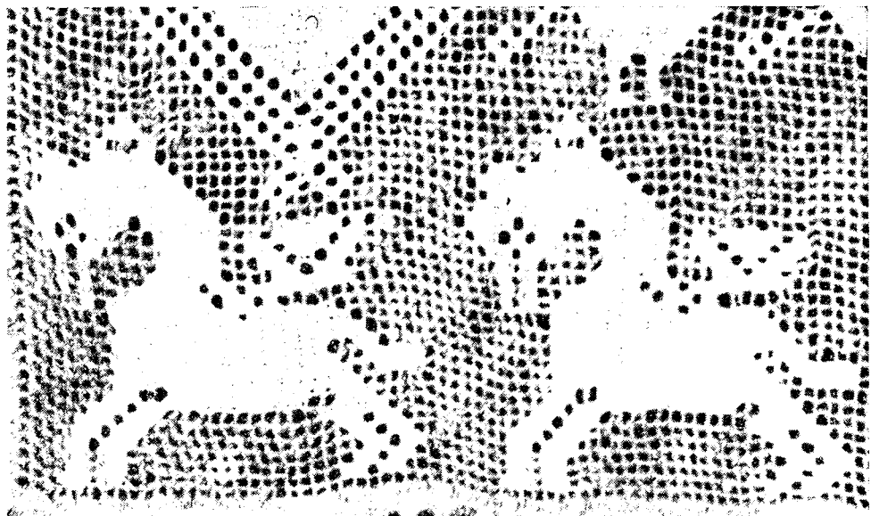
Рис. 1. Кони с крыльями и птичьим клювом. Фрагмент вышивки на полотенце. Бывшая Псковская губ., XIX в. (Собрание ГМЭ народов СССР, № 66—166).

изображения животных, на первый взгляд похожие на коней, но только без гривы. Однако нам представляется, что это изображение лося, а не коня. Это подтверждается самим характером вышивки, на которой мы видим горбоносых животных с массивной верхней губой.