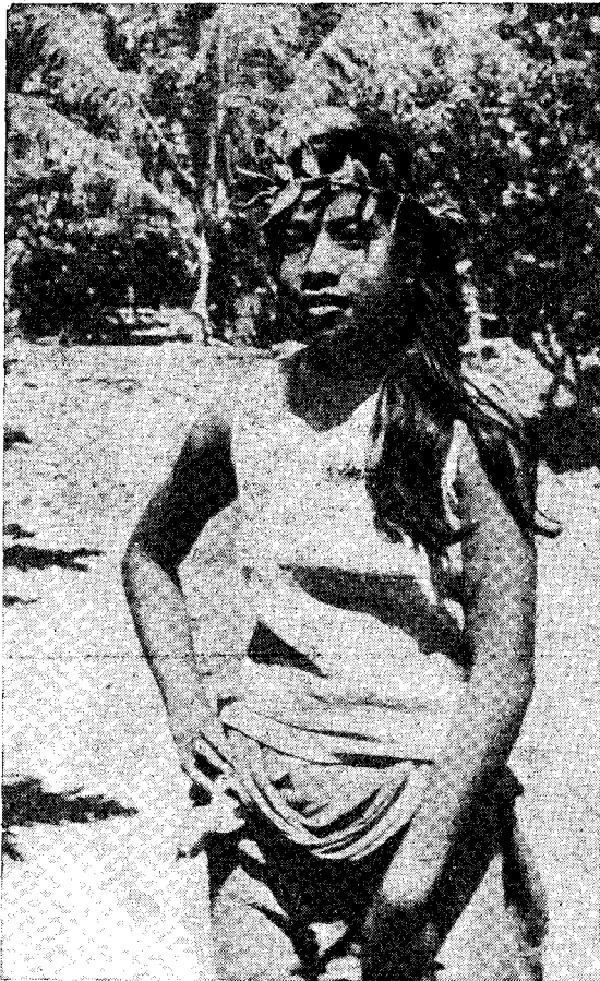
Рис. 7. Девушка-самоанка. Деревня Леусоали (Западное Самоа)

Гвинеи и Новых Гебрид, коллекция современной океанской тапы, музыкальные инструменты, посуда из глины, дерева, тыквы и скорлупы кокосового ореха, одежда из луба, листьев кокосовой пальмы и пандануса, модели домов, лодок и рыболовных ловушек, украшения из раковин и кабаньих клыков, образцы художественного плетения и т. д. 74 предмета куплены, остальные получены в дар от жителей посещенных островов. Уместно отметить, что наиболее многочисленная коллекция (43 предмета) была привезена из деревни Бонгу.