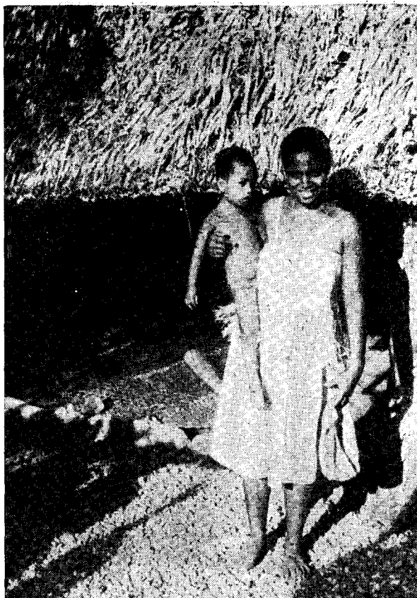
Рис. 8. Микронезийка с сыном. Атолл Марокей (о-ва Гилберта)

денные экспонаты, характеризующие самобытную культуру обитателей некоторых других островов Меланезии. В соответствии с политикой правительства молодого государства, направленной на преодоление отчужденности между фиджийцами и индийцами, составляющими ныне около половины населения архипелага, в экспозицию включены образцы индийской культовой скульптуры.