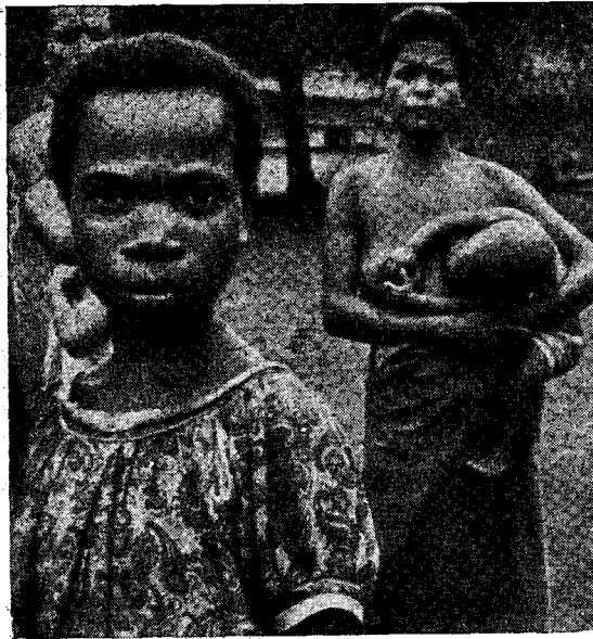
Рис. 3. Жительницы деревни Бонгу

хов и рыбы. Дома стоят теперь на сваях, но в остальном их конструкция мало изменилась. По-прежнему широко распространены циновки, посуда из дерева и скорлупы кокосового ореха, а также глиняные горшки, которые, как и при Миклухо-Маклае, бонгуанцы приобретают в деревне Бил-Бил. На рыбную ловлю местные жители выходят в традиционных лодках-долбленках с балансирами, но употребляют железные рыболовные крючки, а наконечники бамбуковых острог делают из гвоздей.