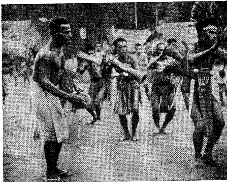
Рис. 5. Традиционный танец. Бонгу