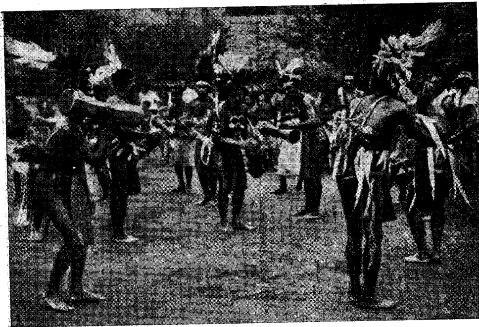
Рис. 4. Праздник в честь экспедиции. Деревня Бонгу