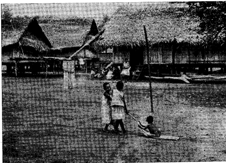
Рис. 2. Деревенская площадь в Бонгу