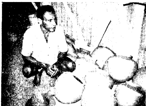
Рис. 2. Житель деревни Били-Били осматривает только что изготовленные женщинами глиняные горшки «ю-боди» (1971 г.)

В докладе П. И. Пучкова (Институт этнографии АН СССР, Москва) «Изменение этнической структуры населения Океании за последние 100 лет» прослежена динамика этнического состава Океании за период, прошедший со дня высадки Н. Н. Миклухо-Маклая на Новой Гвинее. Нарисовав этническую картину Океании того времени докладчик остановился далее на основных миграционных, демографических и этнических