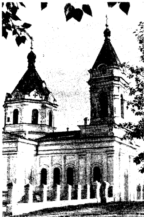
Рис. 2. Собор в Кяхтинской слободе

в своих кашемировых сарафанах и шалях XIX в. летают в Улан-Удэ на самолетах и вертолетах, усилия этих людей кажутся почти нечеловеческими.