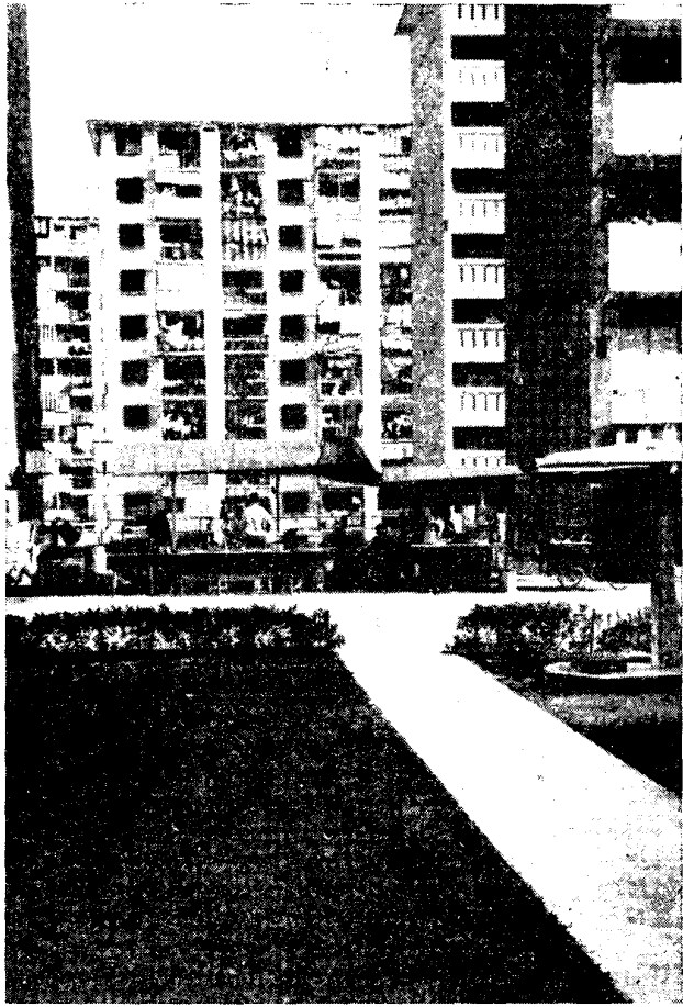
Рис. 1. Новые районы г. Сингапура

Сингапурское правительство стремится поощрять развитие местной промышленности, стимулировать создание новых фирм. Отмечается быстрый рост числа занятых на предприятиях этих фирм: в 1964 г.— 5400 чел., в 1965 г.— 10 500 чел. 20 . За последние 6—7 лет в Джуронг построено и введено в строй свыше 100 заводов и фабрик. Постепенно идет переквалификация Сингапура: прежде он был центром по перепродаже чужих товаров, теперь в его экспорте все большую долю занимает собственная продукция 21 . В 1965—1967 гг. ежегодный прирост промышленной продукции составлял здесь 6—9% 22 . Поддерживая национальную буржуазию, прежде всего китайскую, правительство ввело протекционистские пошлины на ввоз тех 150 видов товаров, которые производятся в стране, а также запретило японцам заключать торговые сделки в Сингапуре с торговцами из третьих стран 23 .