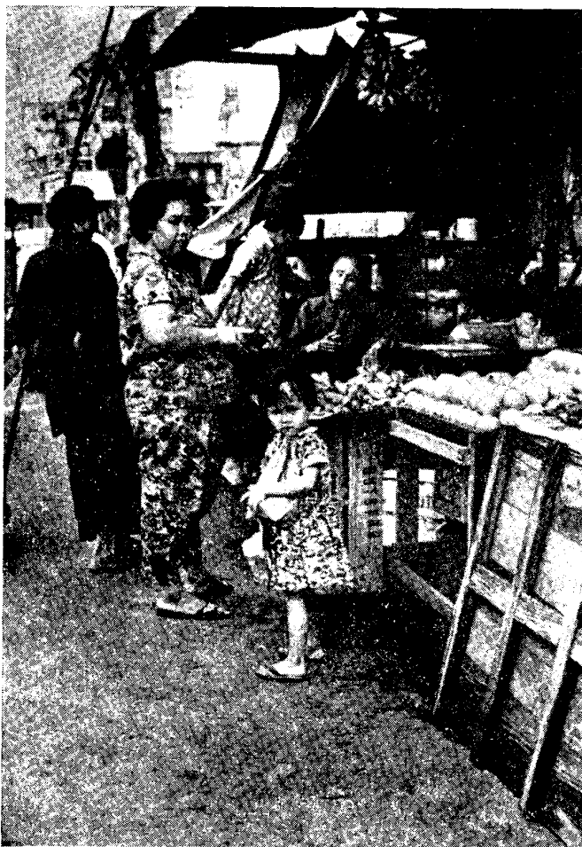
Рис. 3. В китайской лавке

Несмотря на растущее сознание принадлежности к сингапурской национально-политической общности, имеются и центробежные тенденции, в которых основным дезинтегрирующим фактором является разнородный этнический состав населения Сингапура. Обычно каждая из этнических групп сохраняет свою материальную и духовную культуру, свой язык, самосознание и самоназвание. Советские журналисты Г. Ошеверов и С. Свирин, побывавшие в 1966 г. в Сингапуре, отмечали, что каждая этническая группа «живет своей колонией, старается обособиться, сохраняет язык, одежду, культуру, религию. Каждая отмечает свои праздники» 28 . О «разноплеменной толпе» в Сингапуре («кого в ней нет?») писал в конце XIX в. Э. Э. Ухтомский 29 , «пеструю смесь населяющих его народностей» подчеркивал в начале XX в. русский ученый и путешественник И. И. Пузанов 30 . Разобщению этнических групп