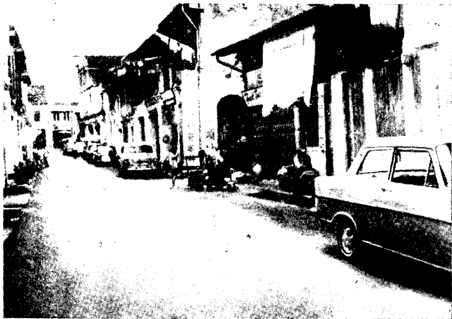
Рис. 2. Старая улица в китайском квартале

В сельском хозяйстве острова преимущественное развитие получило производство продовольствия: согласно оценочным данным, в 1931 г. им занималось 6,4 тыс. чел., а в 1964 г. уже около 25 тыс. чел. Многие хозяйства специализируются на одновременном развитии овощеводства и животноводства (разведение свиней и птицы) 24 . Производством продовольствия преимущественно занимаются китайцы, меньше малайцы.