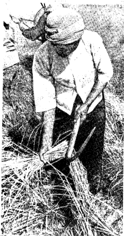
Рис. 1. Уборка риса (провинция Кандаль)

Немногочисленны группы лаосцев (кхмерское название лиу ), живущие на границе с Лаосом, и бирманцев ( пхумие ) в районе Пайлина. В Камбодже свыше 600 тыс. китайцев (кхмеры называют их чэн ), в основном это выходцы из южных провинций Китая (Фуцзянь и Гуандун) и с острова Хайнань. Кроме того, в стране живет более 400 тыс. вьетнамцев (кхмерское название юон ) и немногочисленная группа индийцев (кхмерское название клэнг ).