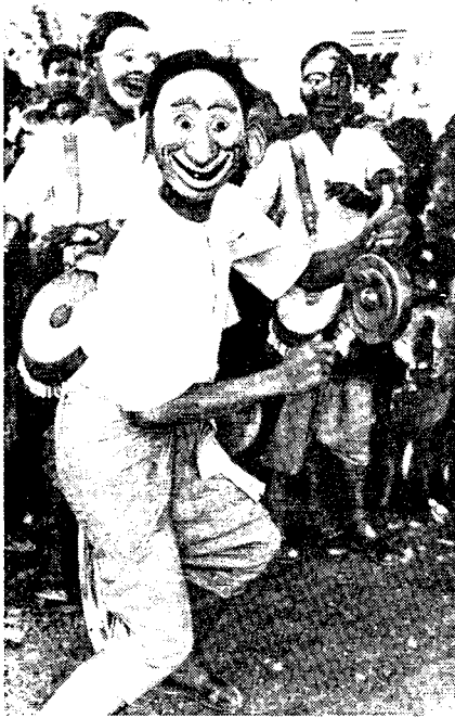
Рис. 5. Народный танец «Чаям» (провинция Кампонгспы)