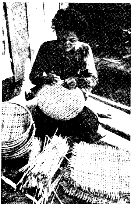
Рис. 3. Плетение корзин (провинция Кампонгчананг)

ев — пхчек ( Shorea obtusa ), тхнонг ( Pterocarpus sp.), сокрам ( Xylocarpus dolabriformis ) и т. д., а также бамбук, ротанг, листья сахарной пальмы ( Borassus flabelliformis ), солома ( Imperata cylindrica ). Полы в помещении, как правило, делаются из расщепленных бамбуковых реек, что способствует хорошей вентиляции. Дома зажиточных городских и сельских жителей строятся целиком из дерева или обожженного кирпича и покрыты черепицей или цинком. В последнее время в столице и провинциальных центрах строят преимущественно двух- или трехэтажные коттеджи по европейским образцам.