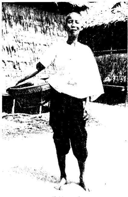
Рис. 4. Крестьянка в традиционной одежде (провинция Сиенреап)

Однако в городах мужчины и женщины, в основном, одеты по-европейски. Служащие учреждений носят белые рубашки с галстуком и брюки. Чиновники обычно одеты в униформу: брюки и куртку цвета хаки. Женщины-горожанки носят длинные темные юбки и светлые облегающие кофточка. И в городах, и в деревнях повсеместно используется по-