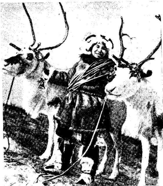
Рис. 1. Володя Каёка — ученик шестого класса Слаутинской школы

Все же известная стабилизация северного промыслового хозяйства, меры по ограничению эксплуататорских элементов, скупщиков пушнины, рост сознательности и политической активности коренного населения