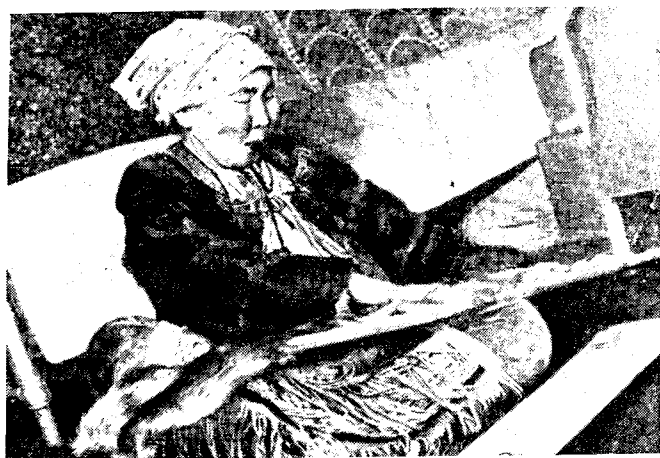
Рис. 2. Мастерница по изготовлению лыж для охотников, село Аянка

Не вдаваясь в описание переустройства всех отраслей промыслового хозяйства, отметим, что характерной особенностью современного этапа развития экономики народов Севера, отличавшейся еще недавно крайней отсталостью, является интенсификация всего северного сельскохозяйственного производства.