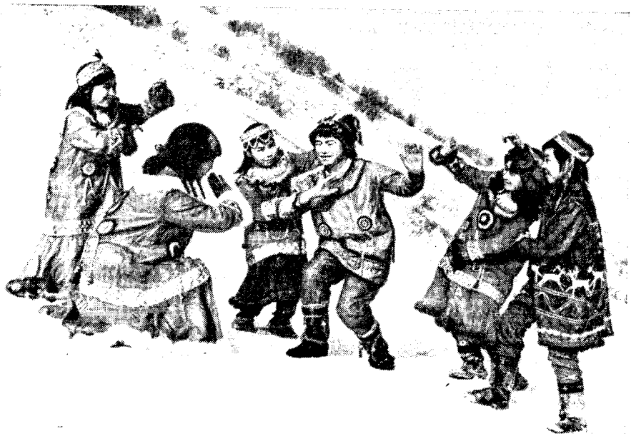
Рис. 6. Детский ансамбль «Каюю» — «Олененок» (Паланская средняя школа — интернат)