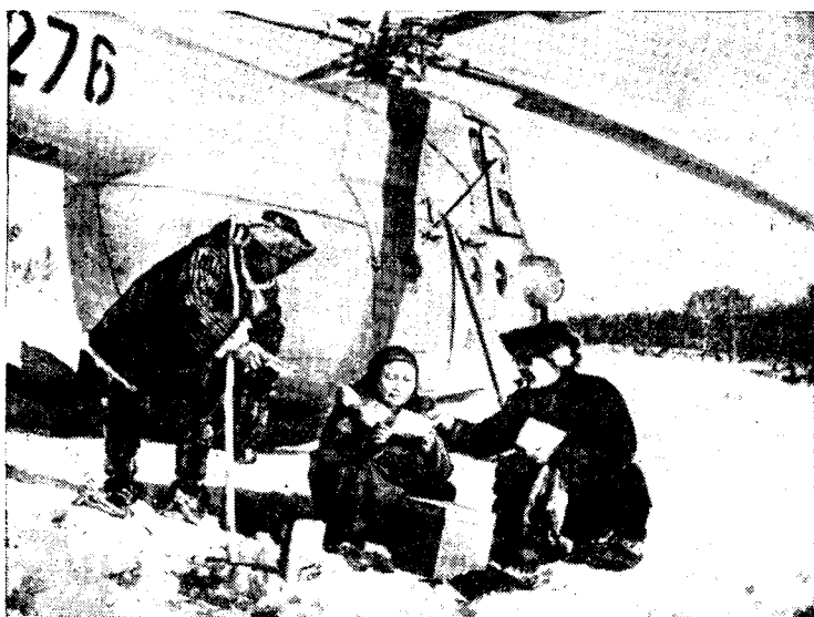
Рис. 8. Голосование пастухов в одном из табунов совхоза Паланский

Особое развитие получило танцевальное искусство народов Севера. Традиционные танцы исполняются не только многочисленными самодеятельными коллективами, но и профессиональными ансамблями. В Корякском национальном округе создан профессиональный коллектив, осуществляющий постановку балета по корякским национальным мотивам. В Чукотском округе в 1969 г. возник большой профессиональный чукотско-эскимосский ансамбль «Эргырьон» (Рассвет), исполняющий традиционные плавные эскимосские и чукотские танцы, пантомимы.