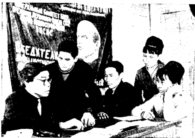
Рис. 7. Актив совхоза Пенжинский.

Продолжает бытовать и устное народное творчество, декоративно-прикладное искусство. Из среды резчиков по кости выдвинулись профессиональные художники. Произведения чукотских и эскимосских косторезов известны далеко за пределами Советского Союза.