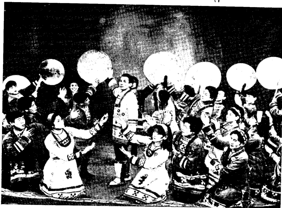
Рис. 5. Ансамбль «Мэнго». Танец «Халало»