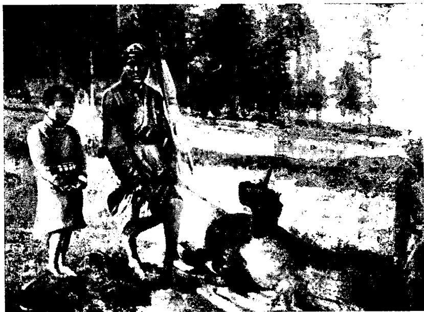
Рис. 2. Старик и мальчики 12 и 9 лет у костра. Сзади виден остров Чулун-куй. 4 июля 1903 г.

цев любопытный обычай: «в течение года невестка ничего не берет непосредственно из рук отца мужа, но берет через другие руки» (стр. 118). Весьма интересно свидетельство А. М. Остроухова о том, что при разводе к отцу переходили мальчики, к матери — девочки (стр. 118). Исследователь ярко описывает тяжелые условия жизни тувинцев в начале XX в., показывает антисанитарные условия, в которых росли дети. Особенно подчеркивает А. М. Остроухов отсутствие квалифицированной медицинской помощи жителям.