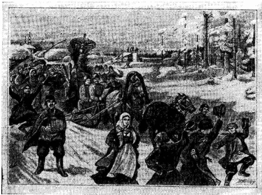
Рис. 1. Сожжение чучела масленицы (гравюра из книги: А. Е. Бурцев, Обзор русского народного быта Северного края, СПб., 1902, т. III, стр. 97)

ряде, теперь же стараются незаметно или совсем снять платье и платок, или заменить их тряпьем» 27 .