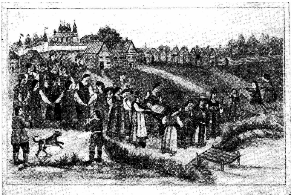
Рис. 2. Похороны Костромы («Вестник археологии и истории», вып. XX, СПб., 1911, стр. 91)