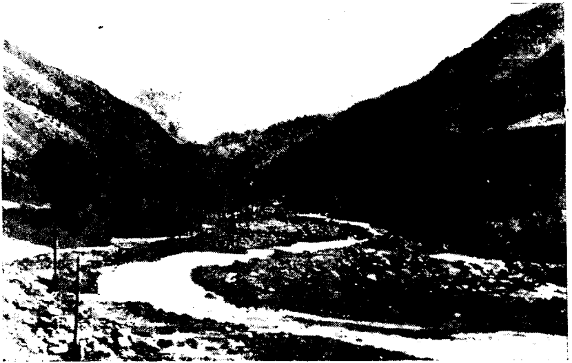
Рис. 2. Кишлак Деи-Малик. Тип селения тагоби

в Варзоб — через Карши и Гиссар, т. е. о пути, каким ездили обычно чиновники бухарского эмира в Восточную Бухару. Неизвестно, застали ли в Варзобе предки нынешних его жителей какое-либо местное население. В литературе сведений об этом нет. Однако тот факт, что местная топонимика (названия кишлаков, особенно заселенных варзоби, урочищ, ручьев) не таджикского, а восточноиранского происхождения, свидетельствует, как нам представляется, об обитании здесь народа, говорившего на языке восточноиранской ветви.