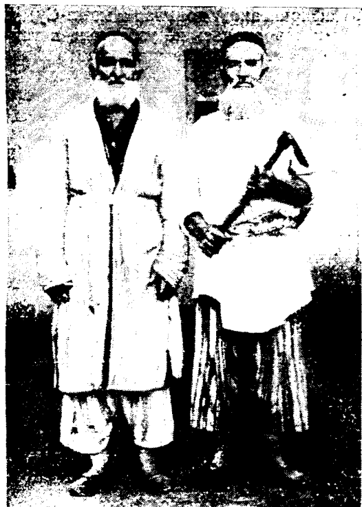
Рис. 5. Таджики-кулоби из кишлака Охток (сельсовет Киблан)

ону, который прилегает к предгорьям 18 . Свидетельства о варзобских сугути подтверждают это; по их словам, они как раз и заселяли северо-восточную окраину гиссарского Сугута.