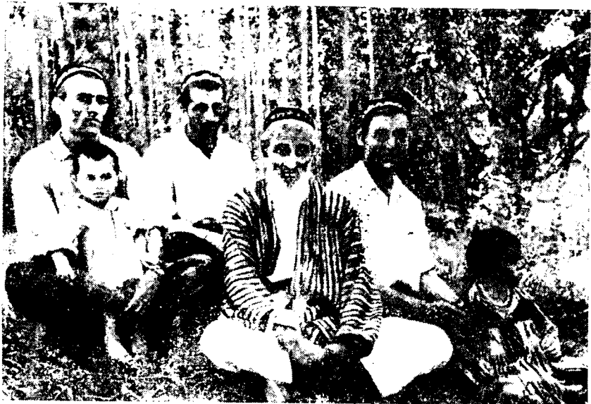
Рис. 4. Таджики-чагатаи из кишлака Алахчин (сельсовет Чорбор)

слово является как бы синонимом слова шахр — город 10 . Само название вилояти по своему содержанию расплывчато, что проявляется в разном понимании его в различных районах: жители верхних кишлаков Варзоба, а также кишлаков по среднему течению р. Варзоб и Такобского ущелья относят к вилояти население предгорий, начиная с кишлака Дахана и ниже, включая исконных жителей Душанбе и Гиссара (как историко-географической области); в южных районах Узбекистана (Сурхандарьинская область) вилояти — это пришлая группа таджиков («пришельцы из разных мест равнины») 11 . Л. В. Успенская при исследовании таджикских говоров Гиссарского района отметила, что жители долинных гиссарских кишлаков, говор которых сходен с говорами кулябских таджиков, отделяли себя по языку от жителей горных кишлаков этого района, называя язык последних «вилояти» или «шахри», т. е. городским 12 .