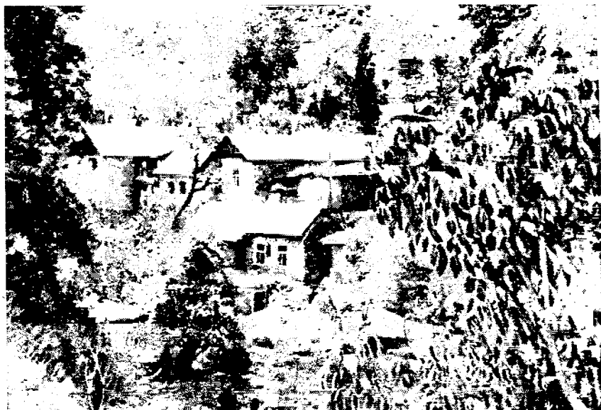
Рис. 3. Кишлак Зимчурд. Тип селения руйови

скими говорами 9 . Последнее обстоятельство как бы подтверждает сведения о зеравшанском происхождении основной части варзоби. В сложении рассматриваемой группы известную роль сыграли выходцы из кишлаков, расположенных в бассейне р. Кафирниган и Гиссарской долине, которую варзоби часто называют валоюят , понимая под этим словом равнинную местность. Следует сказать о связях группы варзоби с жителями различных районов Таджикистана (Дарваза, Каратегина, Куляба), возникших вследствие браков. Нельзя не отметить также влияние тюркских элементов на формирование группы варзоби. Проникновение тюрков шло различными путями; сохранились предания, что отдельные современные таджикские кишлаки были основаны на местах прежних поселений тюрков (карлуков), чаще всего это были летовки последних. К таким кишлакам относятся Гусхарф, Оби-Сафед, Тагов. В некоторых кишлаках есть группы семей, основателями которых были тюрки — кишлаки Гушары (в местном произношении Хушьёре), Тагов, Пшамбе. Наконец, не только в настоящее время, но и в прошлом браки между таджиками и карлуками практиковались довольно широко, смешанные семьи засвидетельствованы нами в ряде кишлаков варзоби.