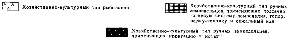
Рис. 2. Хозяйственно-культурные типы на Малых Зондских островах

и мелкий рогатый скот, а также свиней. Имеются и водяные буйволы. В каждом хозяйстве есть куры.