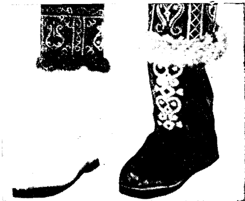
Рис. 5. Унты, работа мастериц быткомбината с. Чурапча, 1967 г.

Однако совершенно неправильны и должны быть признаны просто антихудожественными опыты воспроизведения деревянных чоронов в фарфоре, хотя эти образцы имеются в музеях как положительный пример современного якутского декоративного искусства.