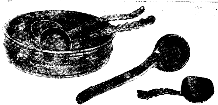
Рис. 2. Кумысная посуда: чаша, черпаки, ложки, XIX—XX в.; пос. Нюрба Ленинского района, школьный музей

По большей части те мастера, которые знают художественную обработку дерева, одновременно являются и кузнецами, мастерами чеканки и гравировки, а также и ювелирами. Якутские кузнечные и ювелирные изделия, в особенности последние, в прошлом расходились по северу Сибири, их можно найти у эвенков, долган, эвенов, даже у народов Дальнего Востока.