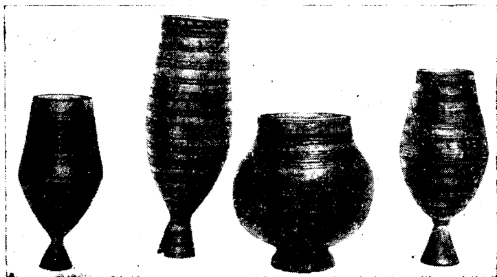
Рис. 1. Чороны XVIII—XX в.; пос. Марха Ленинского района, школьный музей

Характерной орнаментацией чоронов являются горизонтальные полосы — пояски, заполненные мелким резным геометрическим орнаментом типа жгутиков или плетенки;