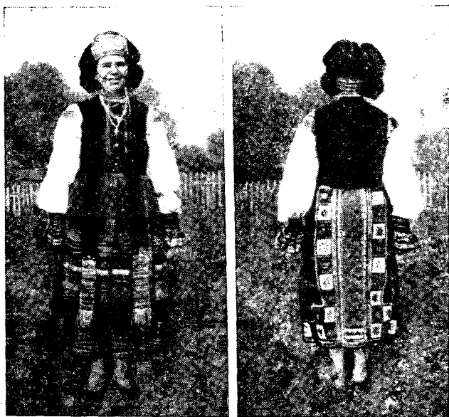
Рис. 1. Крестьянка в традиционном народном costume молодой женщины (с. Солдатское Б. Писаревского района Сумской области)

ми поликами, пришитыми по утку ткани. Много общего имели (как, впрочем, и в других районах) различные названия частей рубахи: «станок» — укр., «стан» — русск., «ластовочка» — укр., «ластовка» — русск., «пидтичка» — укр. «подстава» — русск. Для женских рубах обоих народов характерна вышивка на плечах, на рукавах (ближе к плечу), по воротнику и подолу. У украинцев была распространена вышивка, заполняющая весь рукав узором «дубки». В селах со смешанным русско-украинским населением (например, с. Алешня), где смешение культур из-за тесного повседневного контакта происходило с большой интенсивностью, этот узор вышивали на своих рубахах и русские