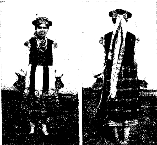
Рис. 3. Крестьянка в традиционном девичьем костюме («девичьей» поневе и «строчке») (с. Ницаха Тростянецкого района Сумской области)