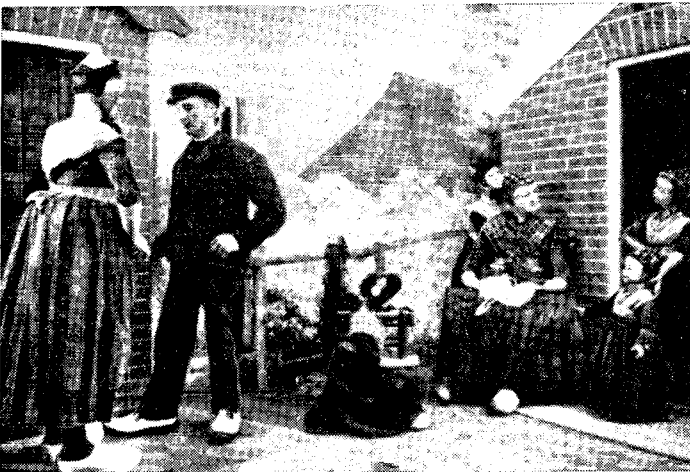
Рис. 1. Экспонаты «Музея Нидерландов на открытом воздухе» в г. Арнем: a — ферма «лосхус», без перегородки между жилым помещением и хлевом; б — та же ферма, интерьер; в — сценка — семь фигур во дворе дома