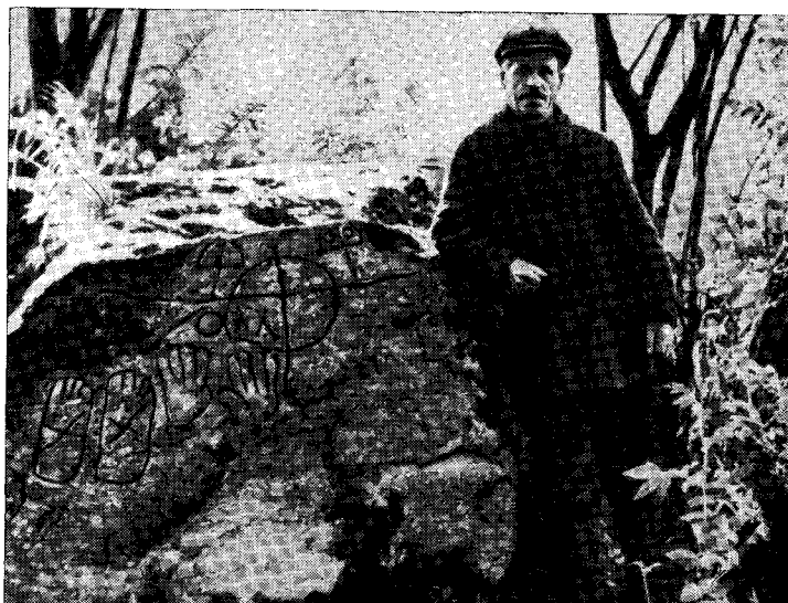
Рис. 1. Гравировки на восточной торцевой стороне камня Щеглец

часто встречаются и в сочетании в одних и тех же комплексах. Из них территориально наиболее близкими к Новгороду являются петроглифы южной Швеции. Они точно датированы благодаря рисункам бронзовых топоров и кинжалов 1400—750 гг. до н. э. 5 Здесь мы найдем все три зна-