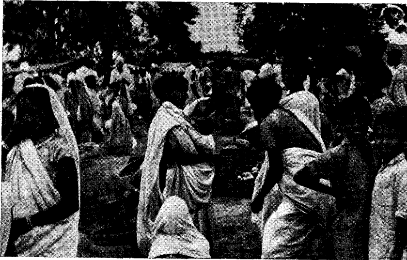
Рис. 3. Ораоны на базаре

Бирхоры нас встретили музыкой и танцами. Вероятно, по инициативе Бишанпурского блока общинного развития они устроили для нас специальную выставку продуктов своего труда, своих орудий, предметов быта и украшений. При входе в деревню был построен в натуральную величину шалаш из веток — традиционное жилище кочевых бирхоров. Здесь нам было продемонстрировано добывание огня трением.