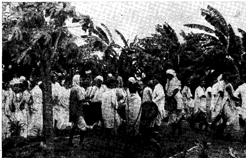
Рис. 2. Танец асуров

На площадке перед мужской начальной школой одна группа учеников проделала гимнастические упражнения, другая спела приветственную песню, после чего начались групповые женские танцы под аккомпанемент танцующих музыкантов-мужчин.