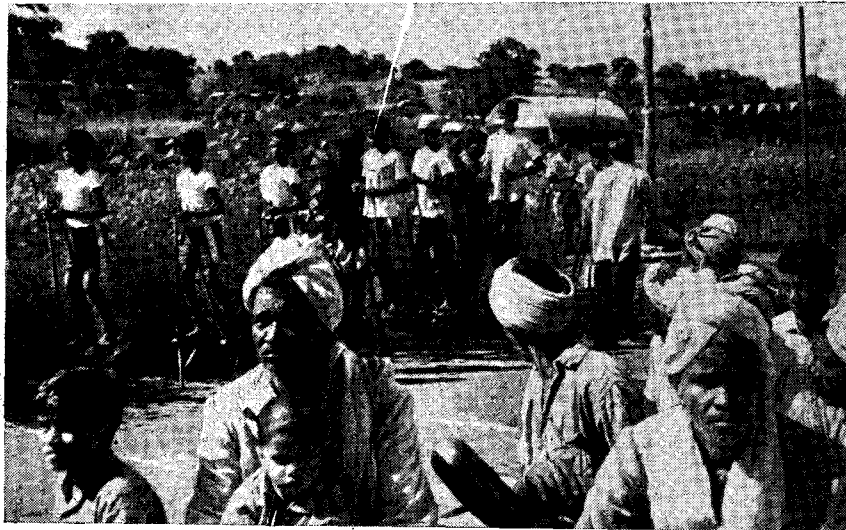
Рис. 4. Танец мальчиков на ходулях у гондов

В общине деревни сложилась особая система взаимопомощи, точнее, взаимных услуг между составляющими ее кастовыми группами — система джаджмани. В отличие от индийской традиции, даже брахманы — высшая каста Индии — занимают здесь подчиненное положение по отношению к джатам как в имущественном, так и в социальном отношениях.