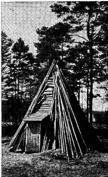
Рис. 4. Летняя кухня двора Кёстриаземе

Постройки первого двора этой зоны — Пульга из бывш. прихода Куусалу — относятся к середине XIX в. Для усадьбы характерно много сравнительно небольших по размеру надворных построек, что часто встречалось в этот период. Хозяйственные постройки расположены во-