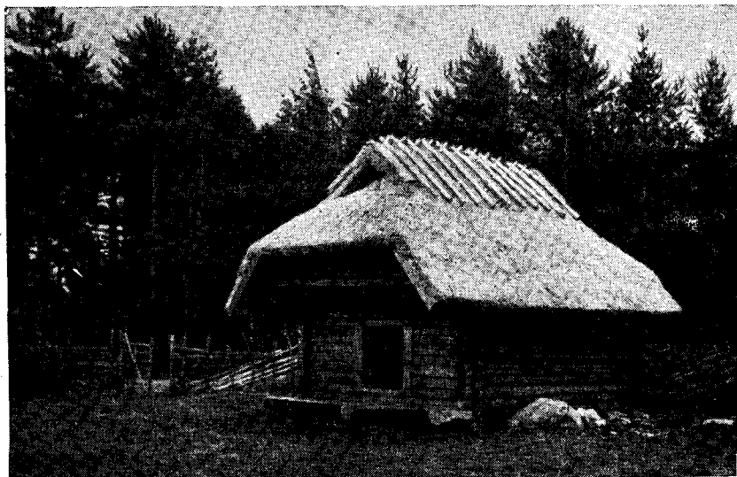
Рис. 3. Клеть двора Кёстриаземе

свободные от дыма, так как отапливались они из риги. Камор стало две, они-то теперь и служили основным жилым помещением для обитателей двора. Полы в каморах дощатые, бревна стен отесаны, пазы меж-