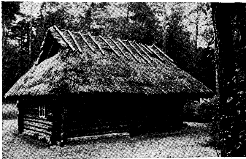
Рис. 6. Баня с каморой двора Кутсари

Жилая рига этого двора построена в 1891 г. и представляет собой очень характерный для северной Эстонии вариант развитой риги (рис. 5). Здесь между высокой традиционной ригой и каморами устроена узкая, длинная, во всю ширину дома кухня, только впереди отделены маленькие сени. Очень характерна система очагов в этом