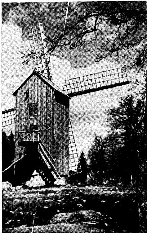
Рис. 7. Ветряная мельница из дер. Нятси

доме. В риге по-прежнему сохраняется курная печь с керисом, так как она наиболее удобна для сушки хлебов. Рига совершенно утратила функции жилья и служит только хозяйственным помещением. В жилой части (каморах и кухне) сложены плита, печь, в которой пекут хлеб, обогревательный щит и лежанка. Вся эта система соединена с дымоходом. Лежанка является определенным техническим усовершенствованием, которое, как и термин, заимствовано у восточных соседей и встречается только в самых восточных частях северной Эстонии.