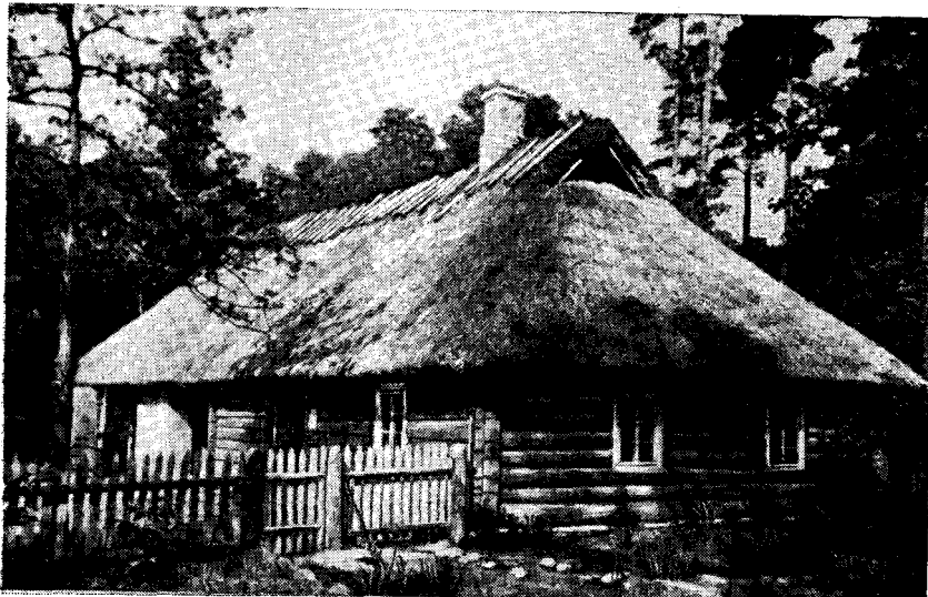
Рис. 5. Жилая рига двора Кутсари

мени усадеб, в которой открытый двор представляет собой правильный четырехугольник; по трем сторонам двора стоят жилая рига, клеть и хлев. При усадьбе имеются сад и огород.