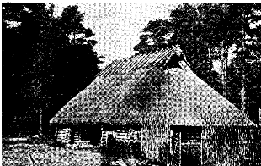
Рис. 2. Хлев двора Кёстриаземе

В то же время в постройках произошел ряд существенных изменений. Вместо прежних холодных камор теперь появились теплые, причем