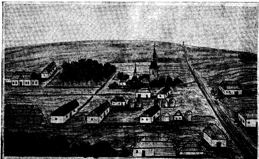
Рис. 3. Село Клюков Киевской губернии. Альбом 1851 г.

Другой альбом 1851 г. 9 не имеет титульного листа и заголовка, он представляет собой собрание преимущественно акварельных рисунков