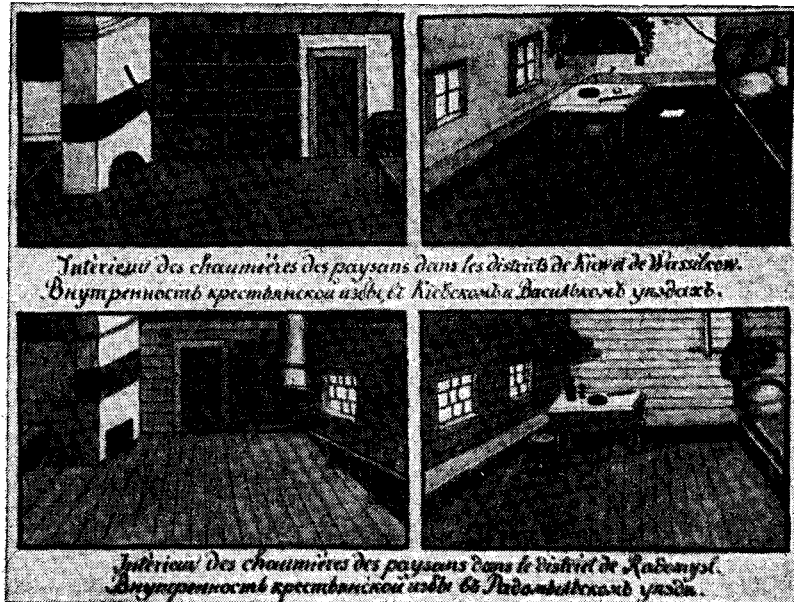
Рис. 4. Интерьер крестьянской хаты. Альбом 1854 г.

порядка и чистоты». Однако истолкование этнографических явлений, выводы работы Деляфлиза оторваны от конкретного фактического материала. Вопреки очевидности того положения, что уровень развития народного быта и форм культуры определяется прежде всего экономическим положением определенных слоев народа, положения, вытекающего из приводимых самим же Деляфлизом данных, он решающим объявляет географический фактор, явно переоценивая его. В своих рекомендациях относительно оздоровления быта крестьян, он как типич-