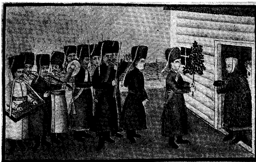
Cérémonies des noces chez les paysans du district de Tassilow, Gouvernement de Kiev. Les uns de la province sont la jeunesse du futur, une le présent le sol, elle a été faite en présence de l'ancien. Свадебні обряди у крестіанів Радомышльського повіту, Київської губернії. Жінки несуть до кімнати подружжя нові підарунки, а чоловік в цей час, вбравшись в народний костюм.