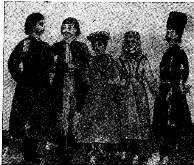
Рис. 1. Народная одежда Сквирского уезда Киевской губернии. Альбом 1849 г.

Особенно важны в них зарисовки народной одежды. На рисунках представлены разнообразные по элементам покроя, по цвету и отделке мужские и женские «сорочки», «свиты», «кожухи», женские «юпки», мужская плащобразная одежда с капюшоном, мужские брюки, женская поясная одежда («спидницы», «запаски», плахты, передники), пояса, головные уборы, обувь. Остановливая внимание преимущественно