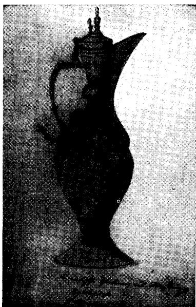
Рис. 2. Сосуд для чая