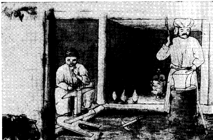
Рис. 1. Мастерская медно-чеканных изделий