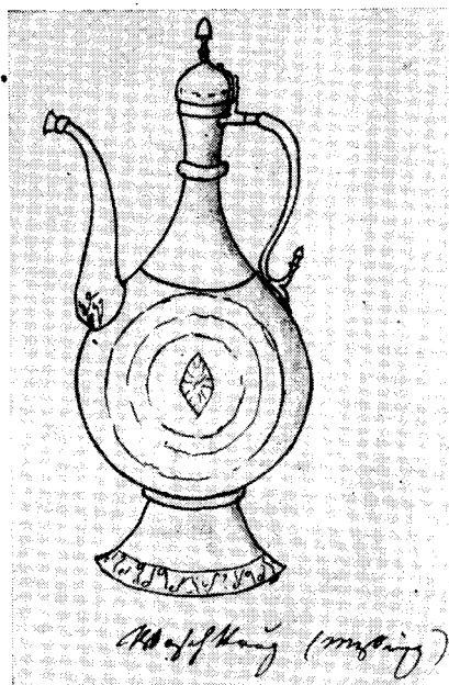
Рис. 3. Сосуд для воды

узоры для украшения посуды чеканкой (9, 12), и, наконец, показан инструментарий мастеров этого замечательного искусства (13).