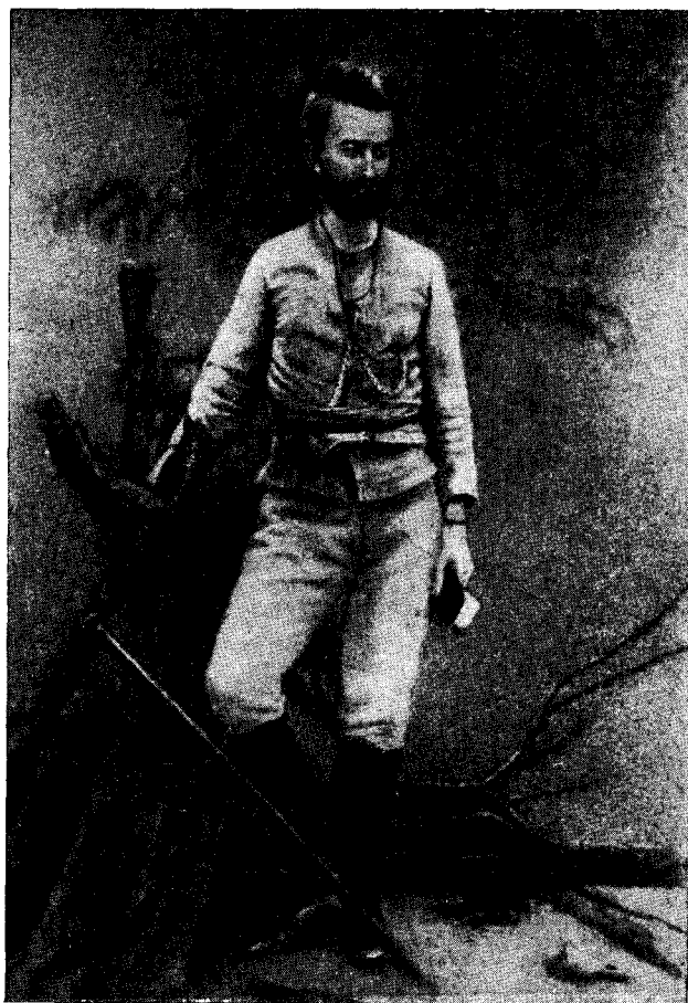
Рис. 1. Н. Н. Миклухо-Маклай в рабочем костюме (публикуется впервые)

категорически отвергавший лженаучное деление человеческих рас на «высшие» и «низшие». «Мы убеждены,— писал он еще в 1857 г.,— что и негр отличается от англичанина своими качествами исключительно вследствие исторической судьбы своей, а не вследствие органических особенностей» 6 . Эти взгляды идейного вождя русских революционных демократов были близки и понятны Миклухо-Маклаю.