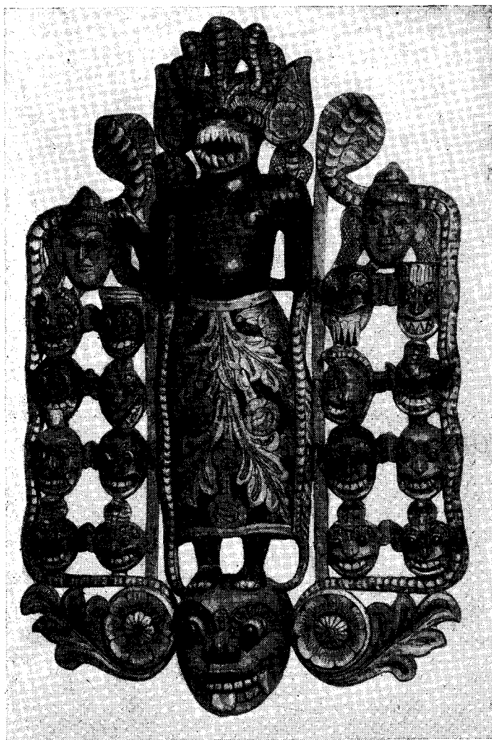
Рис. 2. Демон болезней с его восемнадцатью помощниками

и главной, для которой используются различные по содержанию сюжеты. Главная часть «колам» представляет собой инсценировку одной или нескольких пьесок, содержанием которых служат сказания из древней и новой истории страны, очень много бытовых сюжетов из деревенской жизни. Да и сами представления колам являются порождением крестьянской среды, где они главным образом бытуют и по сегодняшний день.