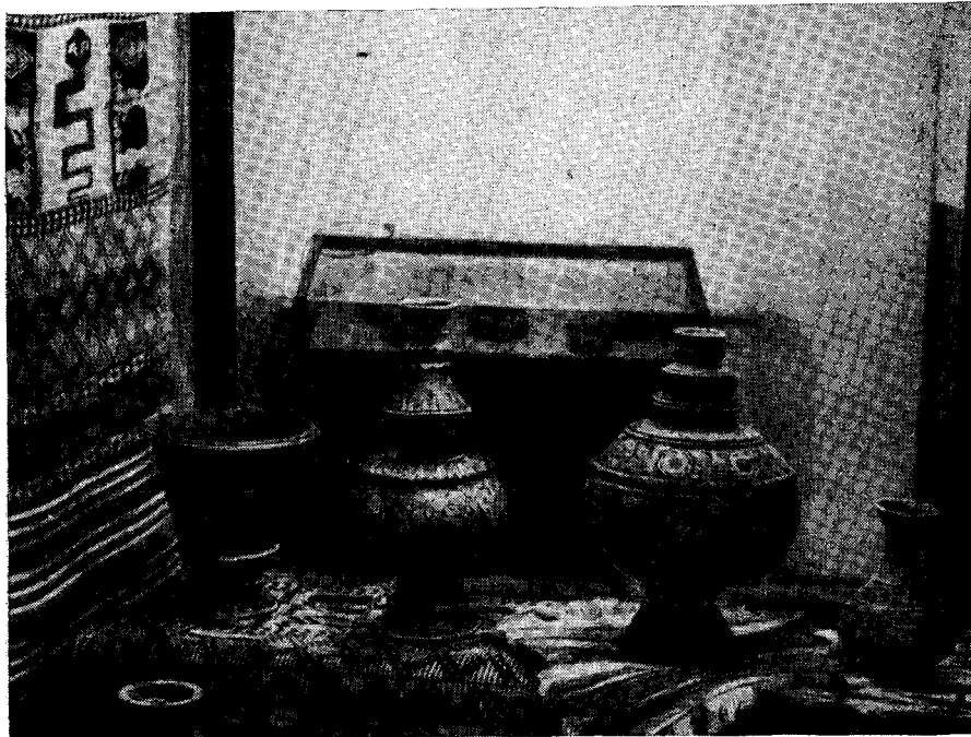
Рис. 1. Декоративная керамика

размеров и в различных положениях. На выставке было представлено много слонов, но ни один не повторял другого. Умение передать настроение, характер животного — вот, по-видимому, в чем секрет цейлонских мастеров. Даже неискушенный человек с первого взгляда видел — этот слон устал и отдыхает, этот — выполняет какую-то тяжелую работу, а этот — чем-то или кем-то разъярен и готовится к нападению.