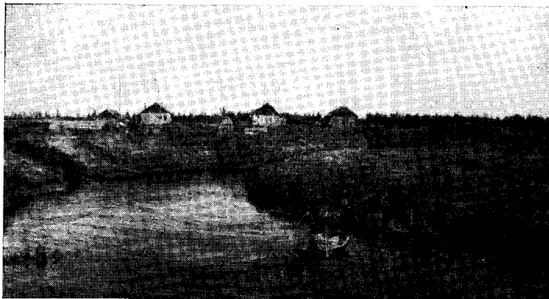
Рис. 3. Пос. Советская речка — усадьба колхоза им. Куйбышева

представители родов Хомпо 3 (Сапожников), Чапогир (Чапогирский, Дярдауль), Кильмагир (Яроцкий), Чумиски (Даурская) и Оёгир (Оягир).