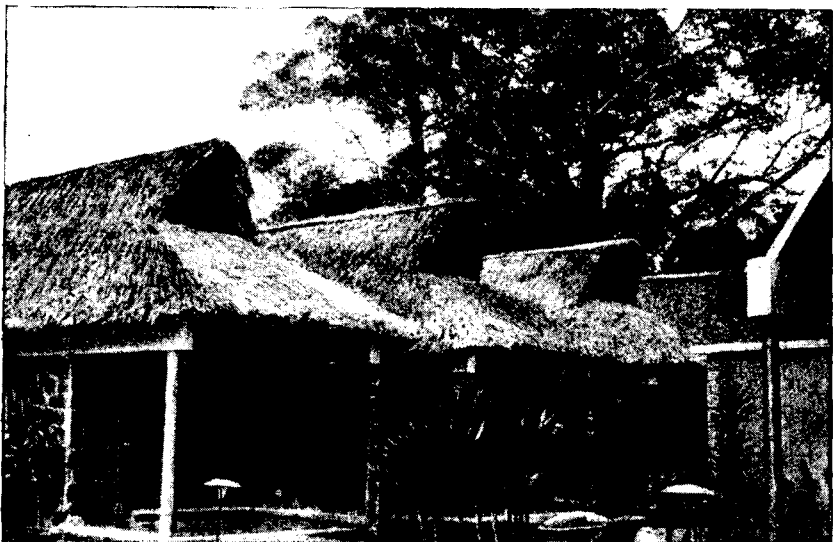
Рис. 3. Новый пансионат для отдыха трудящихся

что вакцинация не требует уколов, снимает препятствия и возражения, особенно среди крестьян. Газеты писали, что по окончании вакцинации детей Куба станет «первой страной Америки, свободной от полиомиелита» 15 .