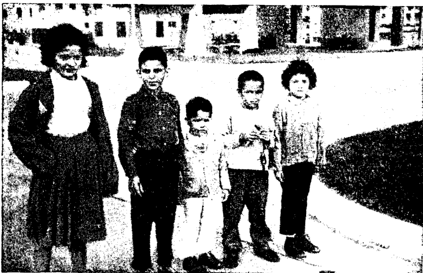
Рис. 2. Маленькие кубинцы

ний, медсестер, воспитательниц детских садов. Только в Гаване в апреле 1962 г. училось 20 тыс. бывших домработниц 12 .