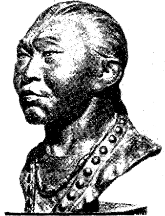
Рис. 5. Реконструкция по черепу из могильника Херексуран-Ури (плиточная могила, Забайкалье)

же принципе взаимосвязи и взаимообусловленности строения скелета и тела животного. Здесь, так же как и в работах М. М. Герасимова, внешний облик дан после тщательного изучения скелета в результате очень кропотливого процесса воссоздания мускулатуры всего тела животного. И так же как в основе реконструкции головы человека лежит череп, здесь основой является весь скелет.