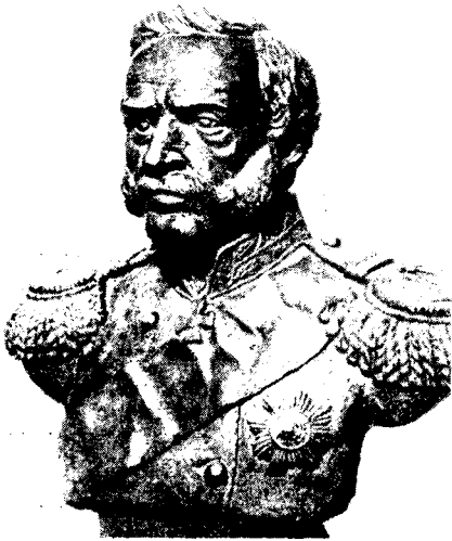
Рис. 1. Скульптурный портрет П. П. Мельникова

Картину эволюционного развития древнейших ископаемых людей демонстрировала реконструкция неандертальцев. Изучение их костных остатков, найденных на территории Европы, Азии и Африки, показало, что в эпоху нижнего палеолита существовало довольно много локальных групп, заметно отличающихся друг от друга. Однако нужно немного сказать о тех общих чертах, которые объединяют эти разные группы древнейших людей и которые так отчетливо прослеживаются на скульптурах. Это, прежде всего, очень большая голова с очень покатым лбом, который плавно переходит в уплощенный низкий свод черепа; тяжелое массивное лицо с сильно развитыми надглазничными валиками, высокое и широкое с сильно профилированными областями скуловых костей, нос большой и очень широкий, подбородок усеченный, на реконструкциях видна и особая посадка головы, ощущается большая физическая сила этих людей.