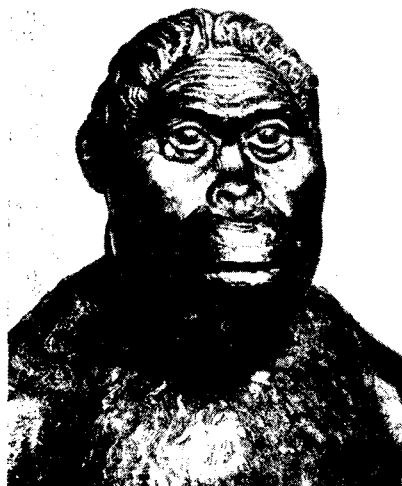
Рис. 2. Плезантрон

Реконструкция по черепу с Маркиной горы передает черты человека экваториального типа: рот довольно широкий с довольно толстыми губами, выступающий нос и т. п. Протоевропеоидный тип, пережитки которого так долго сохранялись у населения с территории Европы, очень ярко выражен в облике кроманьонца. Монголоидные особенности расы уже довольно четко выявились в реконструкции пекинского человека.