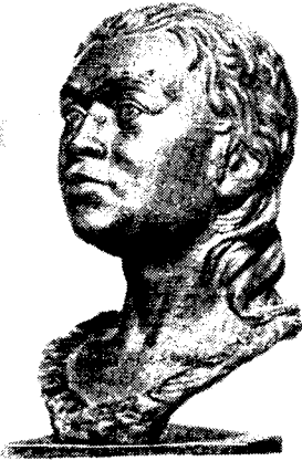
Рис. 4. Женщина из «Шигирского торфяника»

Географическая среда и животный мир, которые играли такую важную роль в жизни древних людей, в особенности в нижнем и верхнем палеолите, на наш взгляд, прекрасно были переданы К. К. Флёровым: небольшие картины (каждая из которых представляет самостоятельный интерес), воссоздававшие быт древних людей, в сочетании с реконструкциями древних людей и животных того времени создавали большое и цельное впечатление. Кстати сказать, методика реконструкций животных основана на том