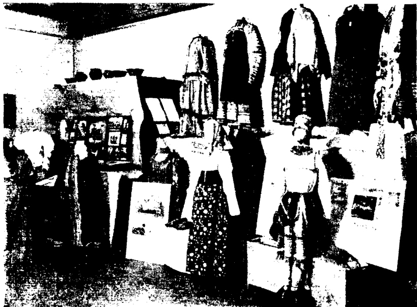
Рис. 4. Материалы Московской областной экспедиции

Экспедиция собрала ряд документов, показывающих деятельность склада сельскохозяйственных машин в б. Херсонском уезде. Документы о задолженности крестьян свидетельствуют, что этот склад, содействуя развитию кулацких хозяйств, в то же время способствовал разорению крестьян-середняков.