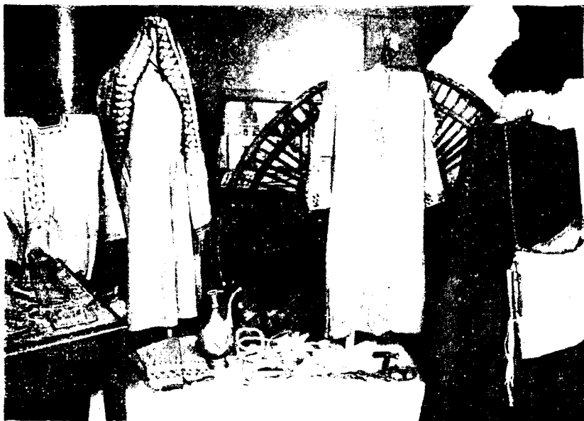
Рис. 3. Материалы Туркменской экспедиции. Одежда туркмен-нохурли

носили нохурские женщины. Они двух типов: «елек» и «пуренджек». Елек украшен большим количеством серебряных бляшек. Рукава его сильно удлинены, сужены к концам и соединены на спине небольшой полоской ткани. Елек шили обычно из красной шелковой ткани с белыми и черными продольными нитями. Пуренджек сделан из ткани черного цвета и богато расшит цветными нитками. Рукава этого халата также имеют декоративное назначение, но в отличие от елека значительно укорочены. Надевая халат, женщина накрывала голову левым рукавом.