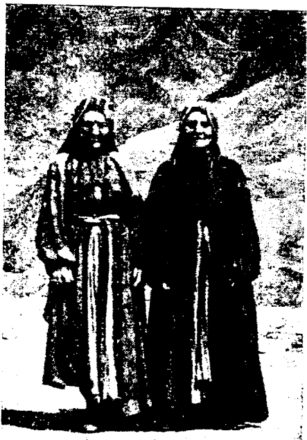
Рис. 5. Пожилые женщины в национальном костюме, с. Тинди Цумадинского р-на

Основным типом современного жилища является двухэтажный каменный дом с плоской кровлей и часто с галереей по фасаду. Первый этаж предназначен для хранения скота и хозяйственного инвентаря, на втором размещаются жилые комнаты и кладовая. Двор в большинстве случаев отсутствует. Его заменяет крыша лежащего ниже дома, и только у годоберинцев и особенно у андийцев часто встречаются специальные дворики, огороженные невысоким каменным забором с воротами. Имеется одна или две, чаще несколько комнат: кухня, жилые