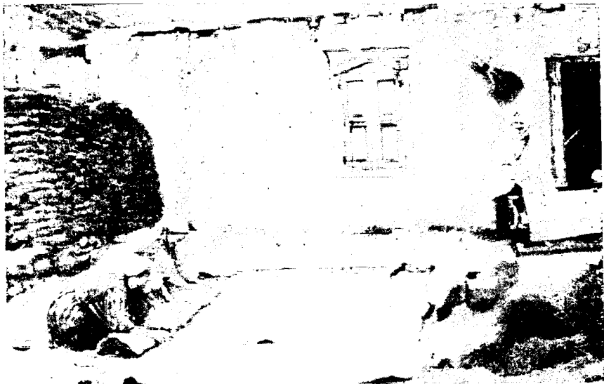
Рис. 1. Валяние бурки в сел. Анди Ботлихского р-на

спросом не только в Дагестане, но и в Чечено-Ингушетии, Кабарде, Осетии, Адыгеи и др. Этому способствуют отличное качество и невысокая продажная цена бурок — 330 руб.