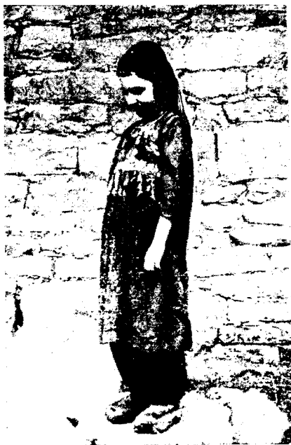
Рис. 6. Девочка-багулалка в национальном костюме, с. Кваната Цумадинского р-на

Девочкам не поручают тяжелой работы, но часть свободного от учебы времени у них занимает уход за младшими братьями и сестрами, помощь матерям по уборке жилища, прополке и сбору урожая на приусадебном участке. Мальчики, значительно