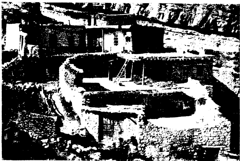
Рис. 4. Тип андийского жилища, с. Гогатль Ботлихского р-на

ботлихское селение Миарсо, багулалское — Хуштада, тиндальское — Тинди, которые расположены на скалистых утесах и крутых горных склонах. Другие селения: андийское — Зило, багулалское — Кваната, годоберинское — Верхние Годобери — размещены более свободно. Улицы нередко кривые. Фасады домов следуют обычно за рельефом местности и не ориентированы по странам света. У обследованных народов существуют два традиционных типа поселения: первый из них — центральное селение, где сосредоточена основная масса жителей; другой тип — хутора (отселки), образовавшиеся