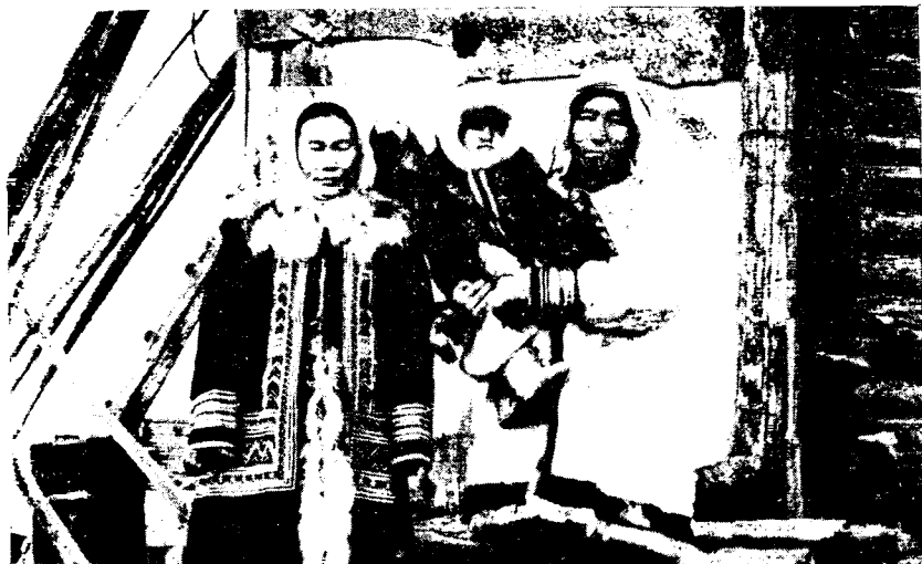
Рис. 4. Долганская семья в зимней национальной одежде (пос. Камень)

траются. Эвенкийская и якутская традиционная одежда в этом районе отличается от долганской (рис. 4) отсутствием украшений. Но каменские эвенки уже начинают украшать свои бакари, парки и шапки по-долгански бисером. По внешнему виду эвенков, якутов и долганов не отличить друг от друга. Можно думать, что через одно-два десятилетия в Камне останутся представители только одного народа — долганов («саха»).