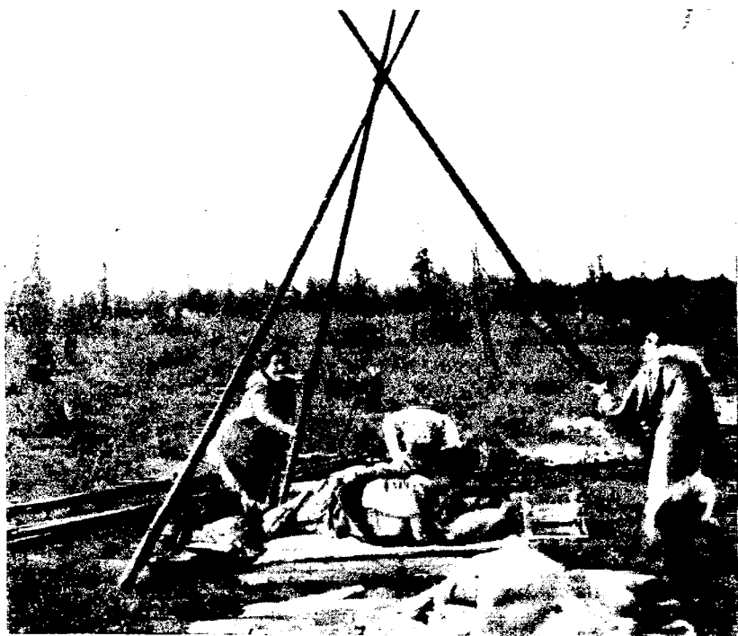
Рис. 3. Установка чума нганасанами (пос. Усть-Боганида)

П. Дульзона на Чулыме, датируемым XVI—XVII вв. Б. О. Долгих приобретены приспособления для изготовления этих пластин. Им собран также ценный материал по иным формам мирсозвращения аборигенного населения этой части Северной Азии. Замечены интересные мифы, характеризующие представления нганасанов о мироздании.