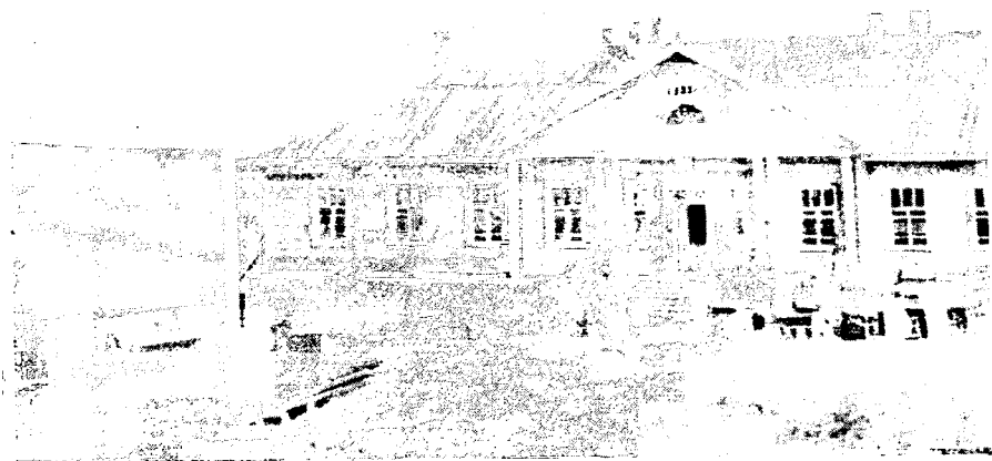
Рис. 6. Школа-интернат в пос. Воронцово