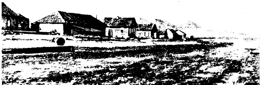
Рис. 7. Вид на пос. Хантайское озеро