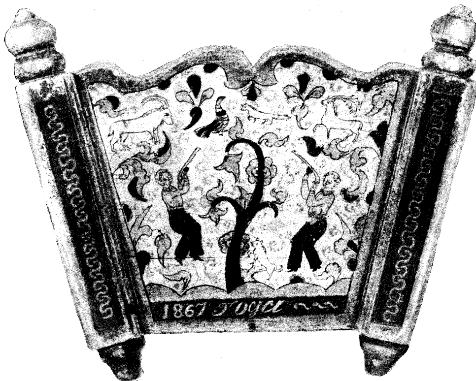
Рис. 1. Колыбель деревянная с пермогорской росписью (деталь). 1867 г. Красноборский р-н (б. Сольвычегодский у.) Архангельской обл.

Северодвинская роспись выделяется своими художественными достоинствами и содержанием. Черным контуром по светлому фону изображены на предметах сцены из жизни крестьян: чаепитие, посиделки, катание на санях. Много сцен трудовой жизни: охоты, обработки земли, прядения и ткачества (рис. 1). Роспись полихромная.