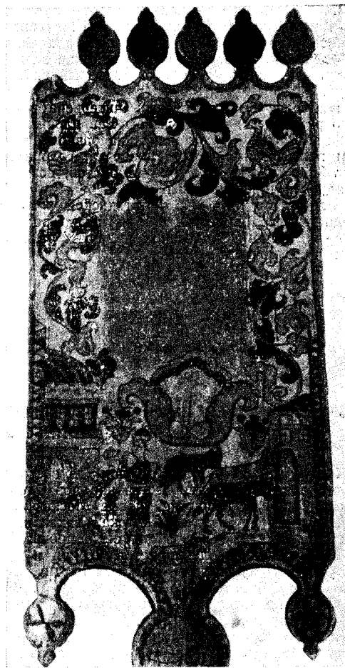
Рис. 5. Прялка деревянная с борецкой росписью. 1-я половина XIX в. Виноградовский р-н (б. Шенкурский у.) Архангельской обл.

В изображениях на обратной стороне лопасти прялок больше свободы и связи с повседневной жизнью: здесь и пастух, созывающий стадо, и охота, и убой коров.