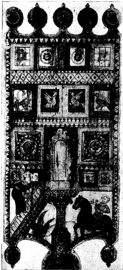
Рис. 4. Прялка деревянная с борецкой росписью. 2-я половина XVIII в. Виноградовский р-н (б. Шенкурский у.) Архангельской обл.

Вторым пунктом работы экспедиции была д. Городок Борецкого сельсовета Виноградовского района (расположенная недалеко от Кургомени). Население здесь тоже является потомками древних новгородцев (б. Борецкая волость была вотчиной известных бояр Борецких). Своеобразие данного района в XIX в. заключалось в том, что здесь преимущественно жили старообрядцы, упорно придерживавшиеся старины. Роспись этого района носит значительно более иконописный характер, чем пермогорская: преобладание красной краски с золотом, деление расписного поля на ряды прямоугольников, напоминающих композиционно иконы в иконостасе. Исполнителями этой росписи были нередко те же мастера, которые писали иконы. Так, по сведениям старожилов, одним из мастеров