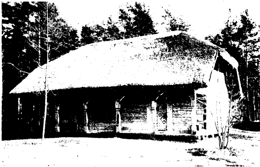
Рис. 2. Курземский сектор. Клеть, построенная в 1767 г.

Жилой дом, перевезенный из б. Елгавского уезда, построен в 1770-х гг. Кухня с мантелскурстенисом делит дом на две части. Налево от кухни — две кладовые, заставленные всевозможными хозяйственными принадлежностями (ручные жернова, маслобойка, деревянная посуда и пр.). Направо расположены жилые помещения. Первая большая комната отведена для батраков. У самой двери стоит двухъярусная кровать батраков-подростков. В глубине комнаты — большой стол, вокруг него скамейки. За этим столом завтракали, обедали и ужинали батраки. У левой стены — большая кровать семейного батрака. У кровати — колыбель с подвешенной подножкой. Мать, сидя на краю кровати, ногой качала молотку, а руки тем временем выполняли разного рода работы: шитье, вязанье, штопанье и др.