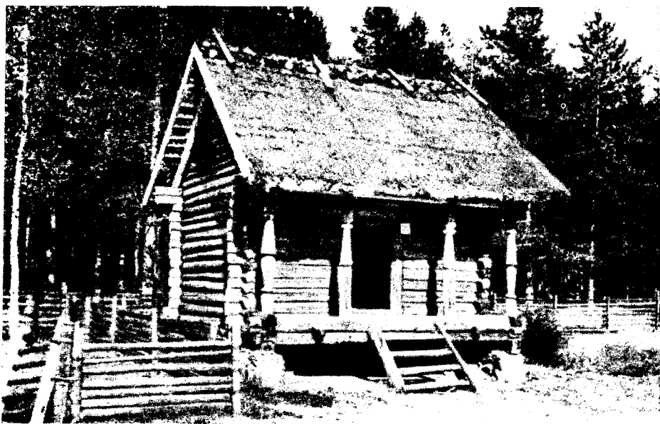
Рис. 4. Латгальский сектор. Клеть, построенная в 1830-х гг

За батрацкой комнатой находятся две комнаты хозяев, обставленные с большой для того времени роскошью. Здесь стоят добротные шкафы, столы, буфет, стенные часы в полированном шкафчике. Богатый хозяин имел возможность заказывать городским кустарям мебель, приобретать фабричные ткани и т. д. Планировка и обстановка дома ярко отражают резкую грань, существовавшую между земгальским кулаком и его батраками.