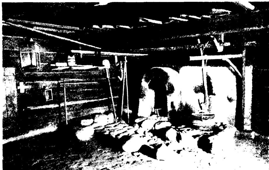
Рис. 3. Курземский сектор. Курная изба рыбака, построенная в 1730-х гг. в рыбацком поселке Нида б. Лиепайского у. (внутренний вид)

Жилой дом, перевезенный из б. Елгавского уезда, построен в 1770-х гг. Кухня с мантелскурстенисом делит дом на две части. Налево от кухни — две кладовые, заставленные всевозможными хозяйственными принадлежностями (ручные жернова, маслобойка, деревянная посуда и пр.). Направо расположены жилые помещения. Первая большая комната отведена для батраков. У самой двери стоит двухъярусная кровать батраков-подростков. В глубине комнаты — большой стол, вокруг него скамейки. За этим столом завтракали, обедали и ужинали батраки. У левой стены — большая кровать семейного батрака. У кровати — колыбель с подвешенной подножкой. Мать, сидя на краю кровати, ногой качала молотку, а руки тем временем выполняли разного рода работы: шитье, вязанье, штопанье и др.