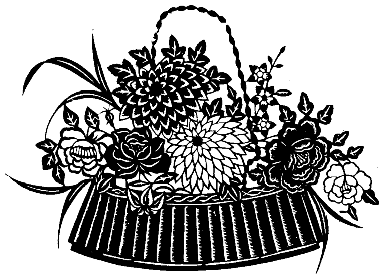
Рис. 1. Художественные вырезки из цветной бумаги. Мастер Ли Чжи-фэй, г. Гуанчжоу