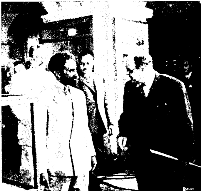
Рис. 1. Император Хайле Селасе I в Музее антропологии и этнографии АН СССР

Специальная витрина отведена для показа документов, говорящих о давних традициях русско-эфиопской дружбы. Особый интерес представляют грамоты, полученные русскими врачами от Менелика II и его супруги императрицы Таиту. В одной