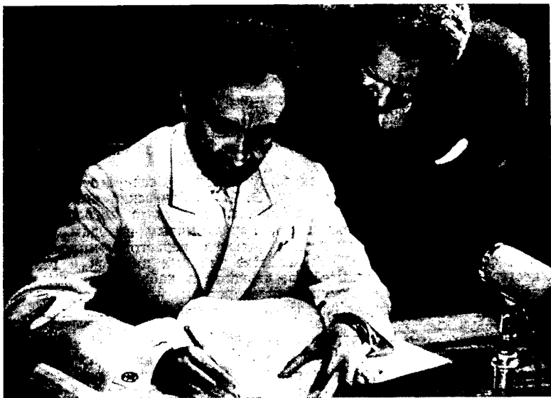
Рис. 5. Император Хайле Селасе I пишет отзыв о выставке Музея антропологии и этнографии

На выставке показано большое количество различных предметов домашнего обихода. Чтобы составить коллекцию этих предметов, многие из которых в натуре очень большого размера, и иметь возможность привезти ее в Россию, А. Н. Гудзенко заказал эфиопским гончарам уменьшенные модели местной глиняной посуды.