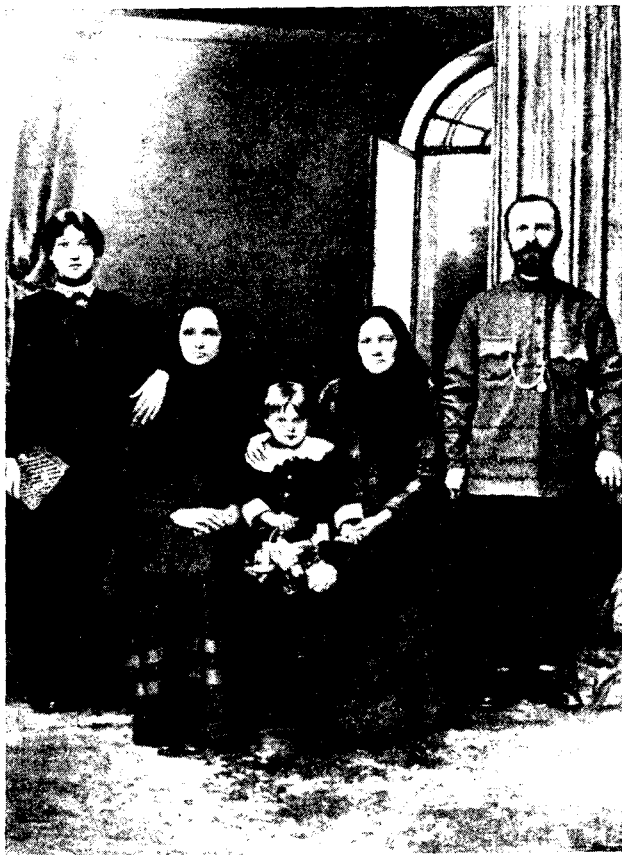
Рис. 2. Семейная фотография рабочих Яхромской фабрики 1913 г.

Экспедиция собрала образцы будничной и праздничной одежды жен маляров и плотников, сшитой на городской манер из сатина и шелка, и на основании рассказов старожилов зафиксировала исчезновение домотканины в обиходе крестьян этого района уже в конце XIX в. Приобретенная здесь домотканная одежда принадлежала