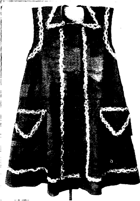
Рис. 5. Часть якутского женского костюма — «корсет». Конец XIX в.

В г. Бодайбо и на приисках, рабочие которых принимали активное участие в забастовке 1912 г., удалось встретиться с одиннадцатью участниками забастовки и пятью