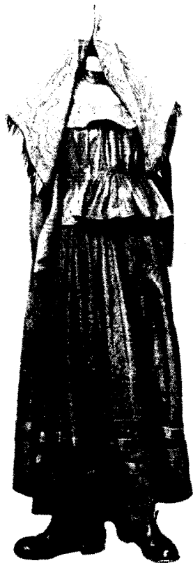
Рис. 3. Костюм латышской крестьянки из района Алсунги. 1890 г.

Характерные для латышской деревни крупные кулацкие хозяйства представлены в материалах экспедиции предметами обстановки зажиточного крестьянства, в кото-