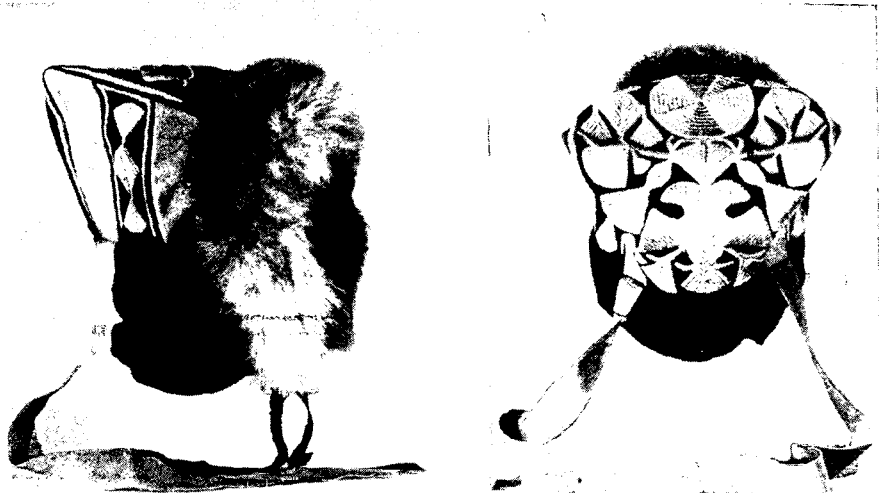
Рис. 6. Якутский женский головной убор. Начало XX в. Сунтарский район

Во время пребывания в городах и поселках Якутии и Восточной Сибири участниками экспедиции были собраны материалы по истории сибирской и якутской ссылки, а также отдельные фотографии и документы, отражающие период борьбы за установление здесь Советской власти. Наибольшую ценность представляют групповые снимки членов молодежных социал-демократических кружков, сложившихся в Якутске при участии ссыльных революционеров, и фотографии Е. Ярославского и Г. Петровского, относящиеся к 1917 г.