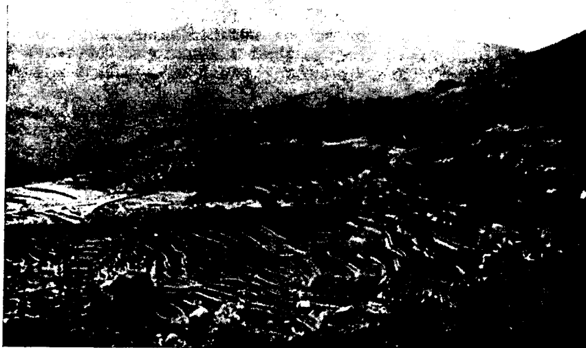
Рис. 2. Орошаемые террасовые рисовые поля

Кокосовая пальма играет огромную роль в питании сингалцев. Считают, что хорошая хозяйка из кокосового ореха может приготовить до сотни различных блюд. Из соцветия готовят также ароматное пальмовое вино — «тодди».