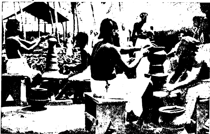
Рис. 3. Гончары-тамилы за работой

В каждом доме большое количество разнообразной, в основном глиняной, посуды, нередко украшенной сложным и красивым орнаментом. Производством глиняной посуды на Цейлоне занято большое число ремесленников. Однако за последние годы в быт цейлонцев все сильнее проникает алюминиевая посуда. Вся посуда в доме хранится в опрокинутом положении на деревянных полках, которые зачастую украшены затейливой резьбой. Глиняная посуда, употребляемая для варки пищи, имеет сферическое утолщенное дно. Пищу обычно готовят на открытом очаге, над которым посуда поддерживается специальными глиняными опорами. Имеются и переносные глиняные очаги.