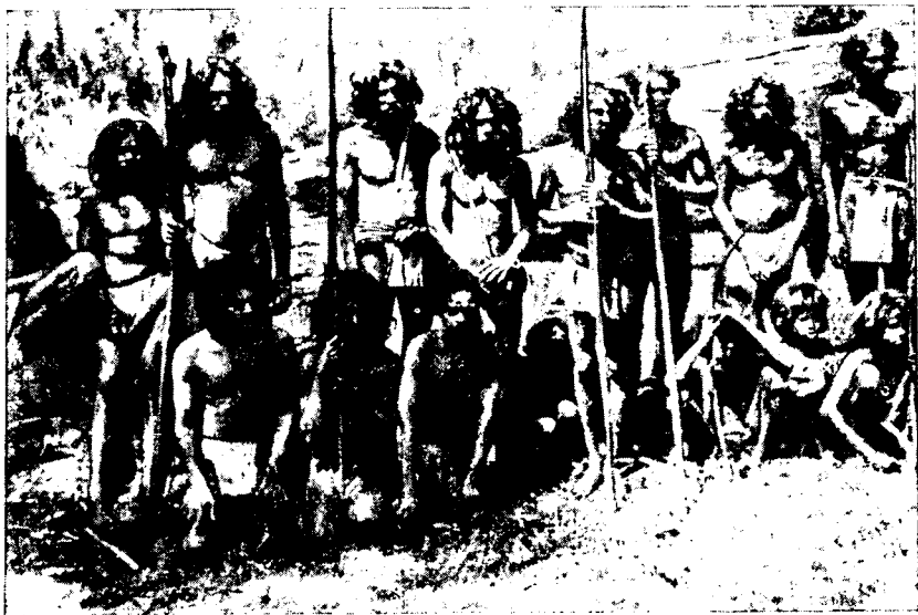
Рис. 6. Группа веддов-охотников

говцев-разносчиков из Баттикалоа. Все остальное, что им необходимо в повседневной жизни, ведды изготавливают сами. Это в первую очередь относится к посуде. Однако гончарное производство их стоит на низком уровне: ведды не знают гончарного круга. Обычно берется глыба глины и ей грубо придается определенная форма, главным образом в виде пшкы. Готовая посуда выставляется на воздух, где она сохнет. Иногда посуду обжигают на очаге. Огонь добывают ведды при помощи трения