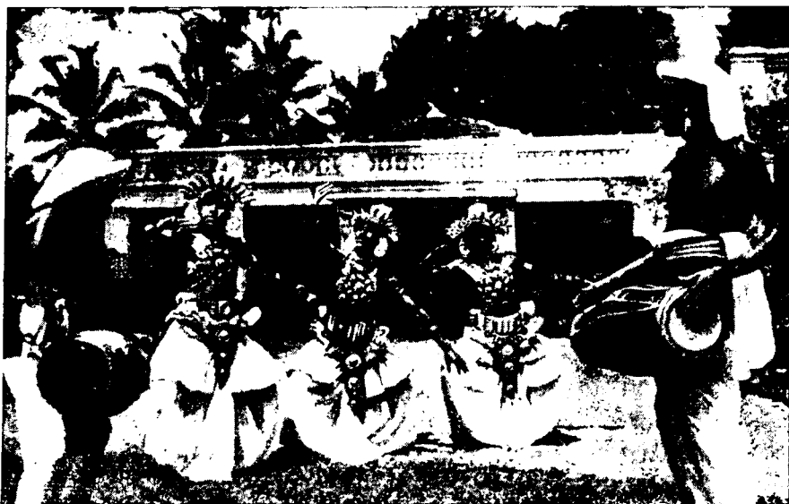
Рис. 5. Кандийские танцоры в традиционной обрядовой одежде

По свидетельству многих путешественников, сингалцы бережно и вежливо относятся к своим женам. Грубое отношение к женщине вызывает всеобщее возмущение жителей, виновный обычно подвергается общему бойкоту. К своим детям родители относятся с большой любовью и никогда не прибегают к телесным наказаниям. Рождение ребенка в каждой семье — большое событие. На основании даты и часа рождения деревенский астролог составляет весьма сложный и подробный гороскоп новорожденного. Сингалцы называют этот гороскоп «синдхан-пота» (лист для памяти). Гороскопу придается большое значение, и он бережно хранится всю жизнь.