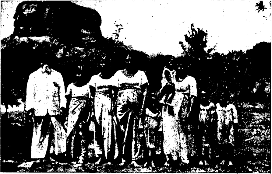
Рис. 4. Сингалская семья

Всеобразно сингалцы убирают волосы. Как мужчины, так и женщины свертывают их в виде греческого узла или шиньона на затылке.