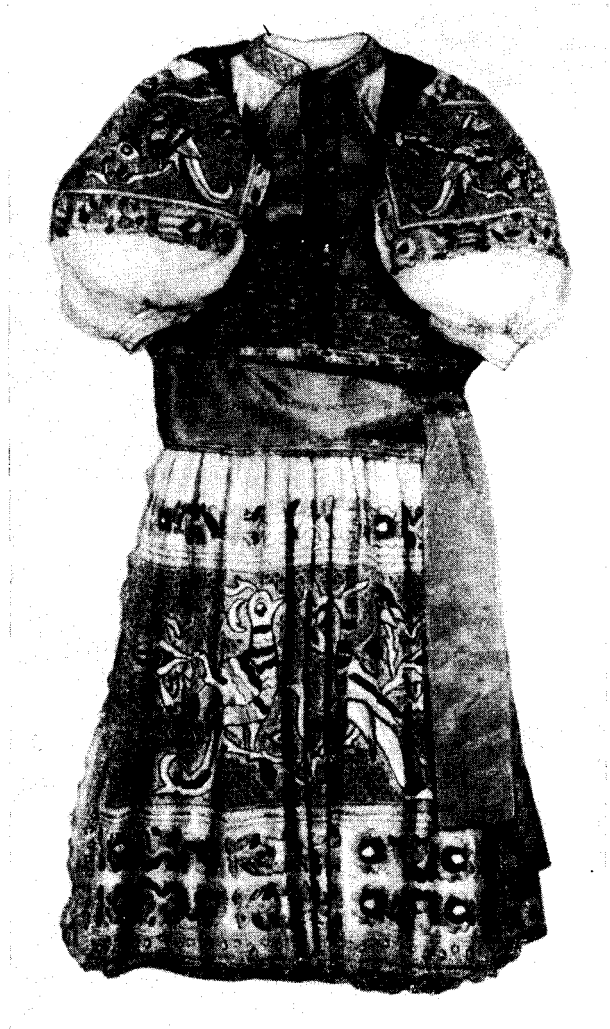
Чехословацкий женский национальный костюм (из подарков Чехословацкой Республики к 40-летию Великой Октябрьской социалистической революции)

Выставка показывает огромную симпатию народов стран народной демократии к Советскому Союзу. Народы этих стран высказывают сердечные чувства благодарности Советской Армии, советским людям и их авангарду — Коммунистической партии, спасшим их от немецко-фашистских захватчиков в годы второй мировой войны. Свою любовь и симпатию они передают в письмах, адресованных ЦК КПСС и Советскому правительству, в текстах, вышитых на знаменах, флагах, скатертях, полотенцах,