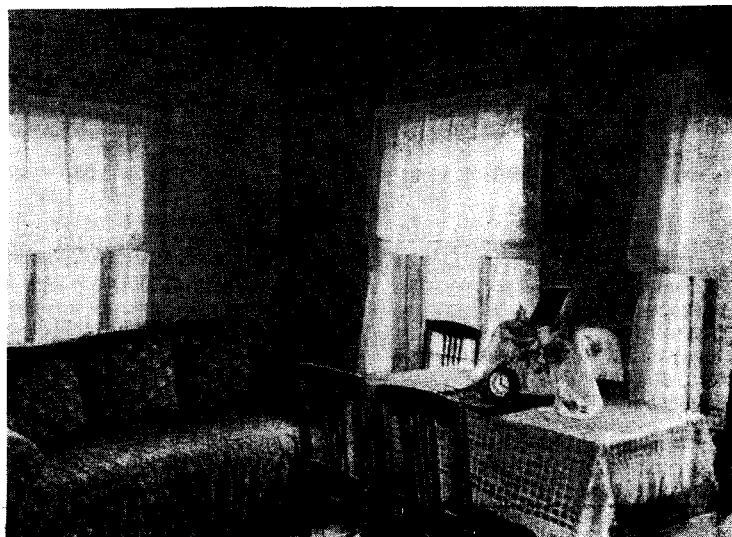
Рис. 5 Убранство «передней» комнаты в доме колхозника С. И. Чубарова (д. Б. Овсяниково Весьегонского р-на)

сельского уклада жизни. Так, например, повседневную верхнюю одежду (мужскую и женскую) шьют преимущественно короткой, удобной для работы (жакеты, пиджаки, стеганки); единственным видом женского головного убора служит платок (рис. 6); при покосе в некоторых местах употребляют лапти. Праздничный же костюм колхозников, особенно молодых, почти ничем не отличается от костюма городских жителей.