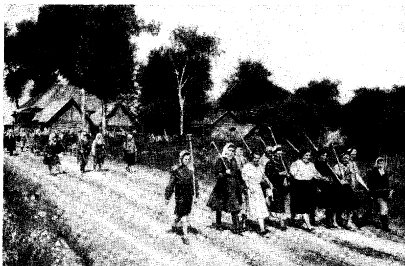
Рис. 6. Выход на работу (колхоз им. Ильича Бежецкого р-на)

В связи с ростом зажиточности колхозников наблюдается значительное улучшение их питания. В дополнение к продуктам, которые семья получает из колхоза и от личного хозяйства, большие средства тратятся на приобретение покупных продуктов питания, таких, как сахар, масло, крупы, рыба, гастрономические и кондитерские изделия, что приводит к повышению калорийности пищи и к большему ее разнообразию. Улучшение ежедневного питания колхозников связано также с тем, что теперь не соблюдают постов и постных дней, занимавших ранее более половины года. Широкое внедрение