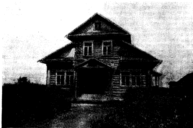
Рис. 1. Здание правления колхоза им. Ворошилова Весьегонского р-на

Жилище колхозников изучаемых районов характеризуется сравнительно высоким подклетом (4—8, иногда до 10 бревен), двускатной крышей, северновеликорусским типом внутренней планировки. К дому примыкает закрытый двор. Преобладающей формой является однорядная связь. Строительным материалом служит дерево, крыши