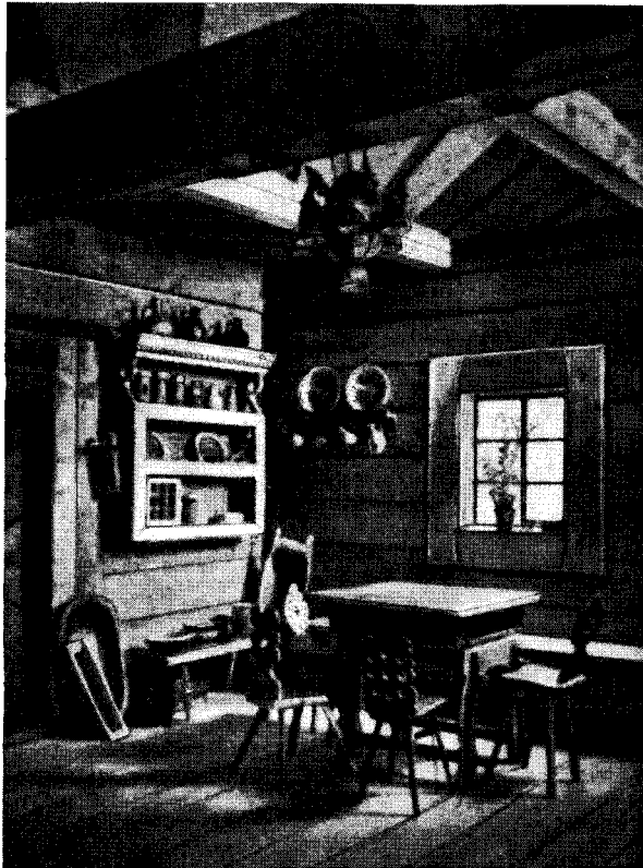
Рис. 2. Интерьер подгальянской избы (Т Sewe g u n, Указ. раб., стр. 12)

Другая выставка музея дает представление о некоторых народных промыслах в Польше. На этой выставке показан внутренний вид мастерских деревенских сукновалов, гончаров и маслобойщиков. В каждой мастерской можно ознакомиться с процессом производства и орудиями труда, употребляемыми в данном промысле.