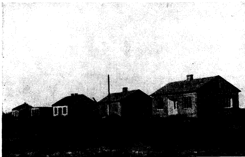
Рис. 5. Строящиеся дома в дер. Яцковице, Лодзинского воеводства.

с книгами, изданными в СССР, постоянно толпились люди самых разных возрастов и профессий. Их запросы отличались большим разнообразием — они покупали художественную и научную литературу, словари, справочники, атласы, детские книжки и другие издания нашей полиграфической промышленности. В этом сказался огромный интерес поляков к советской культуре.