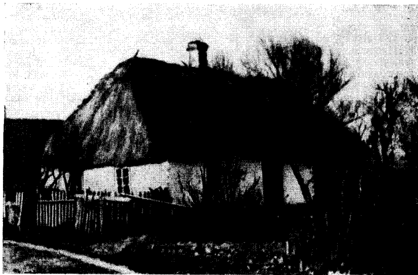
Рис. 3. Изба в дер. Стшала (Стрела), Варшавского воеводства.

В третий раз для ознакомления с культурой и бытом сельского населения я выезжала в деревню Яцковице, расположенную недалеко от города Ловича. Часть жителей этой деревни входит в один из лучших сельскохозяйственных кооперативов