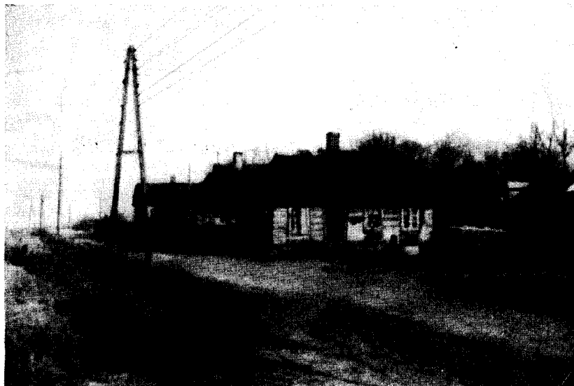
Рис. 4. Изба в дер. Яцковице, Лодзинского воеводства

Я была в Польше во время празднования сорокалетия Великой Октябрьской социалистической революции, когда по всей стране проходили многочисленные митинги и собрания, в кинотеатрах демонстрировались советские фильмы, а на специальных выставках польские трудящиеся знакомились с достижениями СССР в науке и технике, в экономике и культурном строительстве. В праздничные дни на одной из центральных улиц Варшавы был открыт книжный базар. Там, около палаток и ларьков