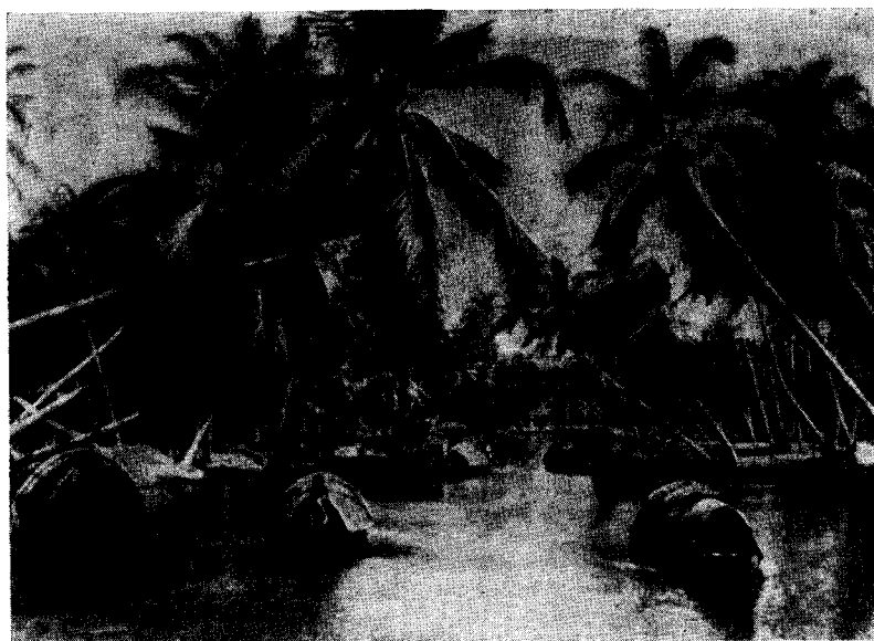
Рис. 1. Канал в прибрежной полосе Кералы

Керала, которую часто называют «страной океана, гор и кокосовых пальм», является одной из самых живописных областей Индии. Она представляет собой узкую полосу земли, ограниченную с одной стороны Аравийским морем, а с другой — горами Нильгири, Пальни и Кардамоновыми.