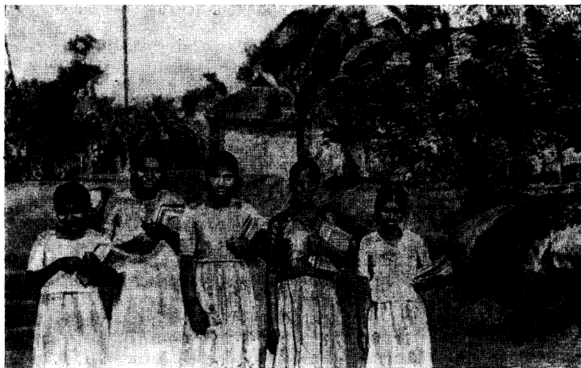
Рис. 4. Девочки-учащиеся Кералы

В 1933 г. были приняты законы, разрешающие всем намбудири жениться на девушках своей касты, а мужчинам-наяркам наследовать имущество, отделяться от тарвада и отдавать свой заработок жене и детям. Эти законы утвердили те изменения, которые практически уже начались в малайальском обществе; вместе с тем они послужили сильным толчком к дальнейшей ломке старого жизненного уклада. В современной Керале осталось лишь небольшое количество традиционных тарвадов и илломов, а дробление их объединенного имущества не только до известной степени нарушает основы крупного землевладения, но и подрывает власть и традиционный авторитет помещиков, которые, как уже указывалось, в подавляющем большинстве принадлежат к этим двум кастам.