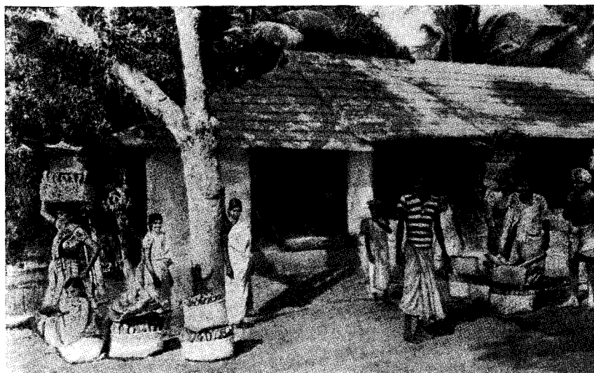
Рис. 2. Крестьяне несут на рынок созревшие бананы

Древними центрами развития национальной культуры малаяли являются города Кералы. Малаяли задолго до начала нашей эры вели морскую торговлю со странами древнего Востока, а позже — с Римом и арабами. Из древних портов развились многие современные города: Кочин (с современным населением в 80 тыс. чел.), Кожиходе, называвшийся раньше Каликут (население — около 160 тыс. чел.), Аллеппи, Поннани и др. Большая часть городов Кералы расположена вдоль побережья или недалеко от него, как, например, столица штата г. Тривандрам (число жителей свыше 177 тыс. чел.). В городах живет 12% всего населения штата.