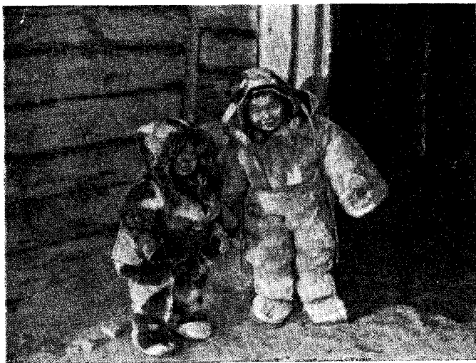
Рис. 8. Корякские дети в меховых комбинезонах (пос. Ветвей, Олюторского р-на)

Много своеобразного и в духовной культуре коряков. Повсеместно в пределах округа коряки сохранили свой родной язык. По данным лингвистики, корякский язык делится на девять весьма отличных друг от друга диалектов. Почти в каждом корякском поселке имеются особенности в говоре. Оседлые пенжинские коряки плохо понимают оседлых тигильских коряков и в особенности олюторских. Хотя в пределах укрупненных колхозов объединены коряки, говорящие на разных диалектах, но эти диалекты не слились. В таких колхозах меньшинство обычно применяется к говору большинства. Так, в колхозе им. Сталина (Пенжинский район), где преобладают нымланы — береговые коряки, чавчувены — коряки-оленеводы в разговоре с ними приспособляются к их диалекту. Некоторые мелкие диалекты береговых коряков исчезают. Общий литературный корякский язык не выработался. Книги, написанные на чавчувенском диалекте, не понятны береговым корякам, и наоборот.