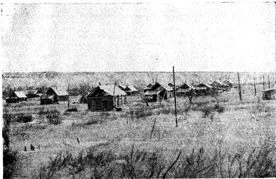
Рис. 2. Поселок Манила — центр колхоза им. Сталина (Пенжинский р-н)

В колхозе «Пролетарий» Тигильского района объединились береговые оседлые коряки селений Палана, Кавран, тундровые эвены и тундровые коряки-оленоводы. Последние продолжают заниматься оленеводством и охотой, тогда как береговые коряки занимаются огородничеством, рыболовством, охотой и скотоводством.