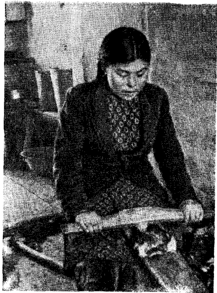
Рис. 5. Выделка оленьей шкуры (пос. Лесная Тигильского р-на)

Объединение распыленных хозяйств оленеводов потребовало создания поселков-хозяйственных баз. После коллективизации в тундре Корякского национального округа возникли совхозные и колхозные поселки. Так, например, центр Пенжинского оленеводческого совхоза — пос. Славутное. Здесь помещается управленческий аппарат совхоза, сельсовет, мастерские, амбары, магазин, семилетняя школа, интернат, больница, клуб, почта, электростанция, дома рабочих и служащих. Центр оленеводческого колхоза им. Жданова — пос. Белоголовое возник в 1939 г. Здесь находится правление колхоза, сельсовет, небольшая молочная ферма с кормозапарником, склады, начальная школа, интернат, фельдшерский пункт, магазин, клуб, почтовое отделение, сорок срубных домов; от старого остались одна яранга и три землянки.