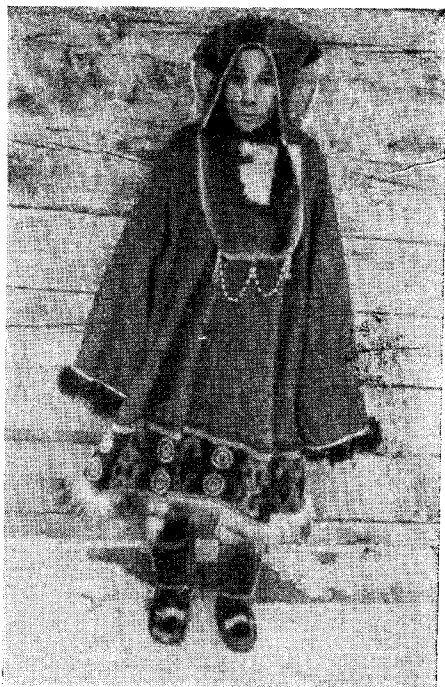
Рис. 7. Девушка-корячка в национальном костюме (пос. Вывенка, колхоз им. Ленина Олюторского р-на)

В корякской одежде сохраняются и региональные различия. В Пенжинском и Олюторском районе носят короткие торбаза (плекут), в Тигильском и Карагинском — длинные, до колен и выше. Карагинские и тигильские головные уборы по покрою отличаются от пенжинских и олюторских: первые — чепчиковобразного покроя с козырьком из собачьего меха, вторые — мешкообразные с выступающими углами. По способу украшения различается также одежда пенжинских и олюторских коряков (рис. 7—10).