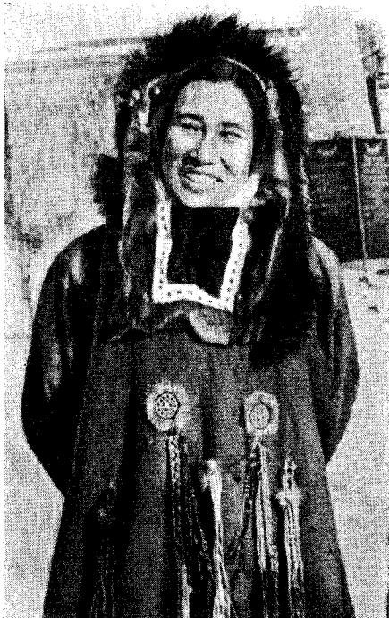
Рис.9. Корячка-участница художественной самодеятельности в национальном костюме

Корякские промысловые праздники, так же как и связанная с ними обрядность, в значительной степени ушли в прошлое, а в ряде случаев слились с советскими. В декабре в Олюторском, Карагинском и Тигильском районах теперь отмечают Новый год, устраивают елку; к этим торжествам в некоторых семьях присоединяется «праздник нерпы». В колхозе им. Кирова Тигильского района (основное население — коряки-олeneводоы) праздник «первого теленка» передвинут несколько вперед и празднуется вместе с Днем Советской армии, 23 февраля.