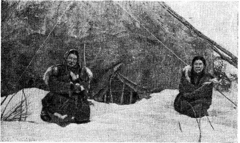
Рис. 6. Яранга с окном (пос. Белоголовое Тигильского р-на)

Обобществление оленей, создание крупных колхозных оленеводческих ферм освободили значительное количество рабочих рук. Многие семьи оленеводов перешли к рыболовству, охоте и стали оседлыми; но значительная часть населения, занятого непосредственно оленеводством, вынуждена кочевать. Оленьи стада находятся в постоянном движении, и, в зависимости от времени года и пастбищ, бригады пастухов перекочевывают через каждые два-три дня, неделю или месяц. Оленьи стада обычно кочуют в десятках, а иногда и в сотнях километров от поселка. Поэтому производственное кочевание оленеводов в условиях Корякского национального округа неотделимо от бытового. Пастухи кочуют вместе со своими семьями; женщины, члены семьи пастуха, не только помогают при перекочевках, но и обслуживают пастуха: шьют, чинят и сушат его одежду, готовят пищу. Значительная часть рабочего времени женщин уходит на выделку шкур и пошив меховой одежды. Шкуры выделываются очень тща-