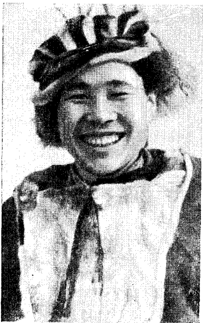
Рис. 10. Коряк-оленеvod в национальном костюме (пос. Хаилино Олюторского р-на)

В Пенжинском, Олюторском и Тигильском районах Корякского национального округа встречаются небольшие группы эвенов. Сами себя камчатские эвены называют орочами, а камчадалы и ительмены называют их ламутами. Камчатские эвены в