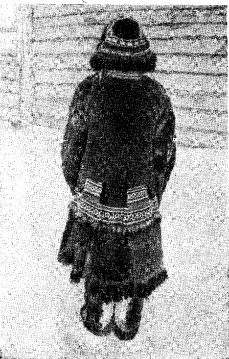
11. Эвены в национальных костюмах (пос. Хаилино Олюторского р-на): а — мужской костюм; б — женский костюм