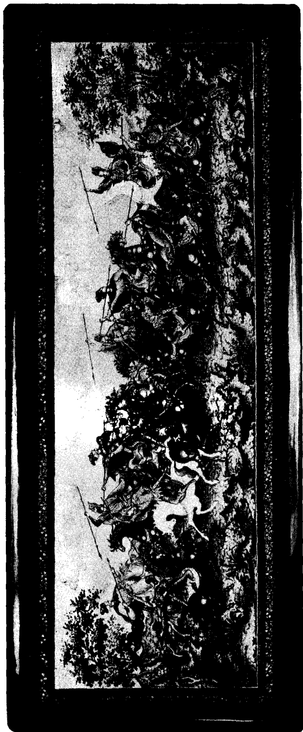
Рис. 1. «Битва». Перчаточница. Метёрская миниатора на папье-маше. Художник—заслуженный деятель искусств РСФСР И. Н. Морозов