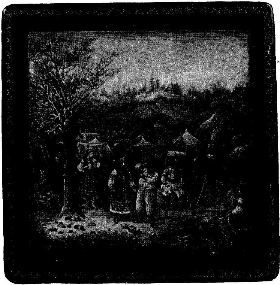
Рис. 2. «Сорочинская ярмарка». Шкатулка. Метёрская миниатора на папье-маше. Художник—заслуженный деятель искусств РСФСР И. А. Фомичев