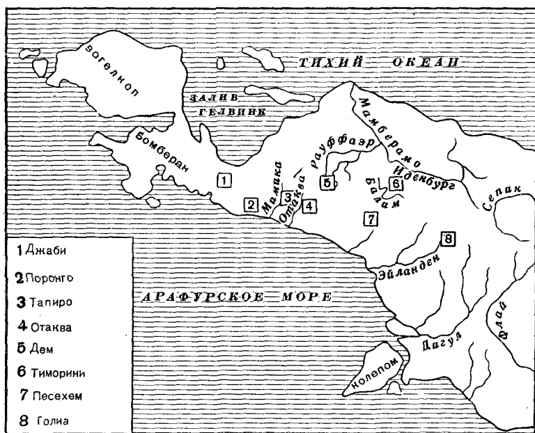
Рис. 1. Расселение низкорослых племен Западного Ириана (схематическая карта)

Рассмотрим более подробно эти три группы языков (см. карту, рис. 2).