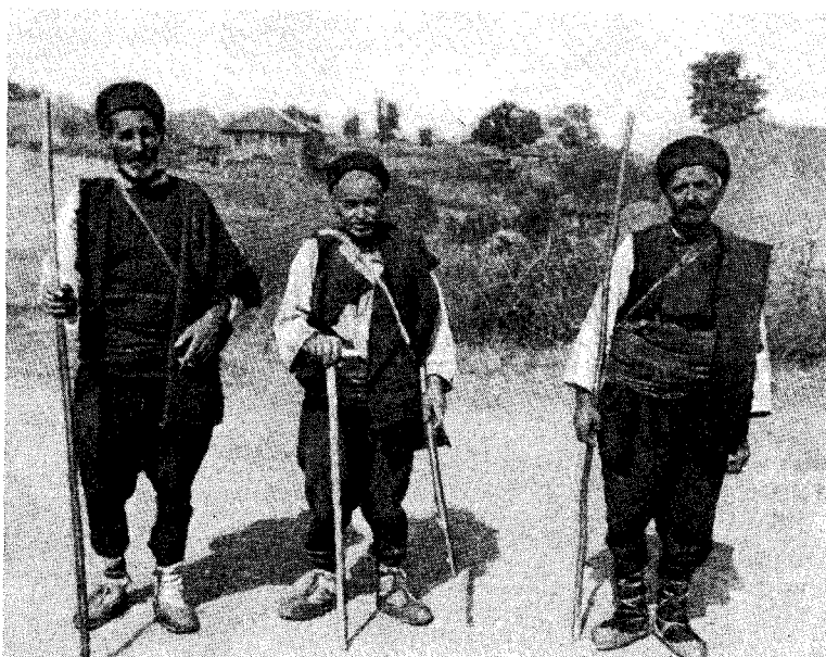
Рис. 3. Пастухи в национальной одежде (сел. Горно-Ябълково)

Козичино расположено в гористой малоплодородной местности. Сюда почти не было притока населения извне. Село жило довольно замкнуто. Жители говорят на своеобразном диалекте. В отличие от болгарского населения большинства районов среди козичинцев много блондинов и шатенов со светлыми глазами.