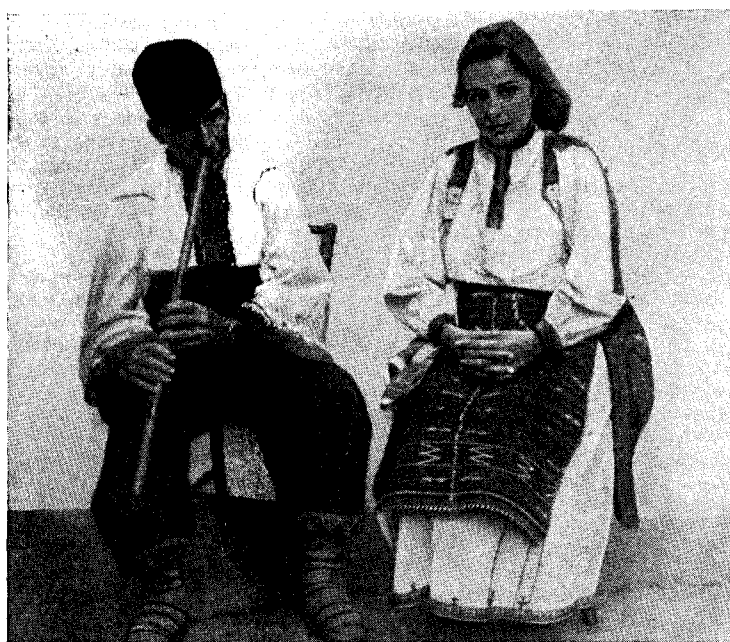
Рис. 8. Крестьяне из с. Вълчи трън в старинных костюмах