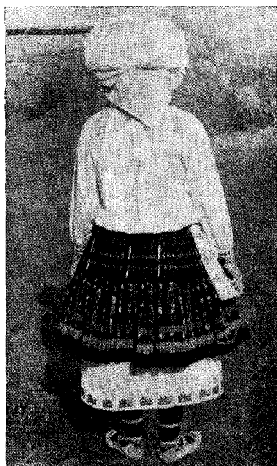
Рис. 7. Старинная женская одежда (с. Вълчи трън Плевенской околии)