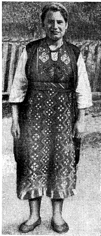
Рис. 2. Женская одежда в западной Страндже (сел. Горно-Ябълково Грудовской околии)

Район к северо-западу от г. Бургаса имеет иное, чем Странджа, этнографическое лицо. Мы побывали здесь в селах Гюлёвцы и Козичино (Поморийская околия). Эти два села, отделенные расстоянием в 8 км, существенно отличаются друг от друга.