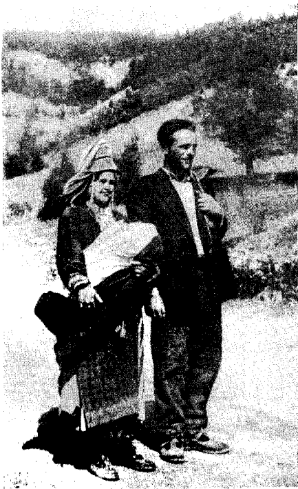
Рис. 5. Болгары-мусульмане (с. Петково Ардинской околии).

За годы народно-демократической власти заметно поднялся культурный уровень крестьян. Люди живо интересуются внешней политикой, внутренним положением в своей стране и в СССР, агротехникой.