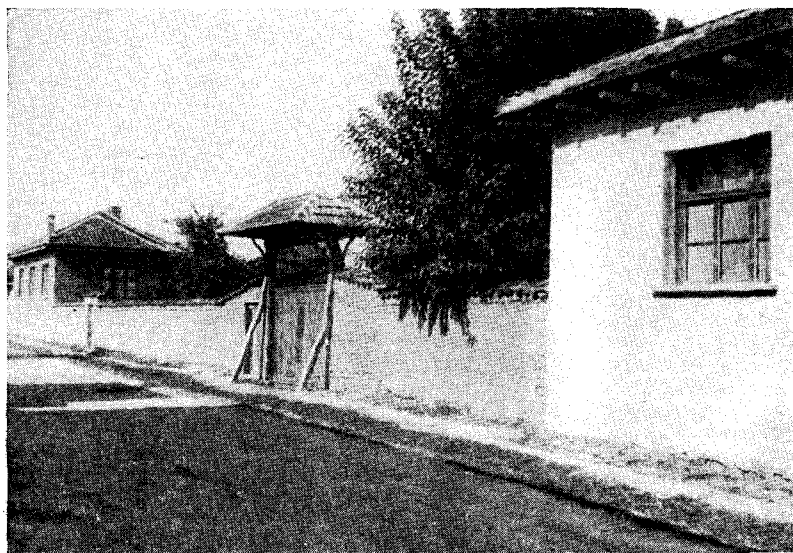
Рис. 4. Улица в с. Ръжово-Конаре (2-я Пловдивская околия)

Село еще не кооперировано. При подъезде к селу хорошо видны поля крестьян. Это мелкие, неправильной формы клочки земли, разбросанные по склонам гор. До сих пор практикуется трехполье с принудительным севооборотом, пахут обычно деревянным ралом на волах, так как почва камениста и неровна.