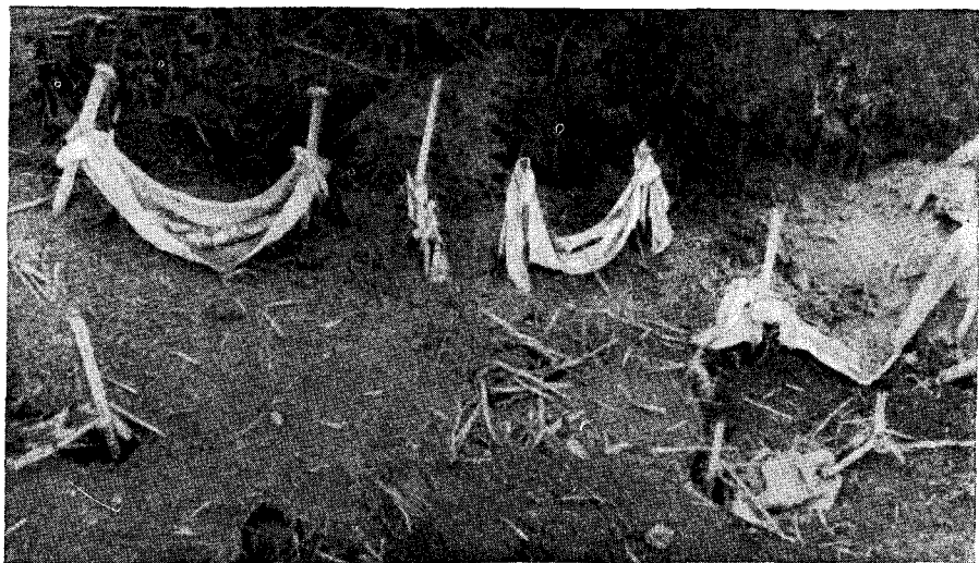
Рис. 3. Имитация детских колыбелей «бешик»; их расставляют у мазара бездетные женщины, чтобы испросить себе у «святого» потомство (Куни-Ургенч).

Казалось бы, здесь мы имеем дело с обстановкой, созданной для того, чтобы сохранить в тайне от окружающих религиозный обряд, участие муллы, что в современных условиях может скомпрометировать жениха, невесту, их родителей в глазах общественности. Однако выяснение причин этого явления показало, что указанные меры предосторожности весьма далеки от подобных мотивов, а вызываются исключительно боязнью