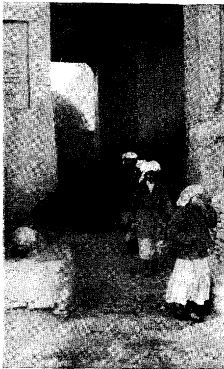
Рис. 4. Казашки-паломницы, идущие от мавзолея Тюрабек-ханум (Куня-Ургенч)

В Хивинском и в Ханкинском районах вызов шамана или шаманки в случае болезни, семейного несчастья и т. п. — довольно частое явление. Старые опытные шаманы проводят свои сеансы по всем правилам, иногда в течение двух-трех дней; при их камланиях, разделенных на определенные этапы — «давры», помимо традиционного кружения с бубном, совершаются жертвоприношения духам, манипуляции с огнем, с отточенными мечами, на которые полбин вскакивает босыми ногами, и прочие действия.