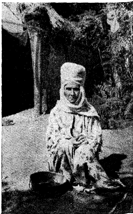
Рис. 2. Повитуха «момо». (гор. Ханки)

Обращает на себя внимание то обстоятельство, что никах стремятся совершить при минимальном числе свидетелей, тайно, когда все разойдутся или даже через несколько дней после свадебного тоя. Допускаются только близкие люди. На дворе, около окон, на крыше, у ворот стоят своего рода пикеты из родных и знакомых.