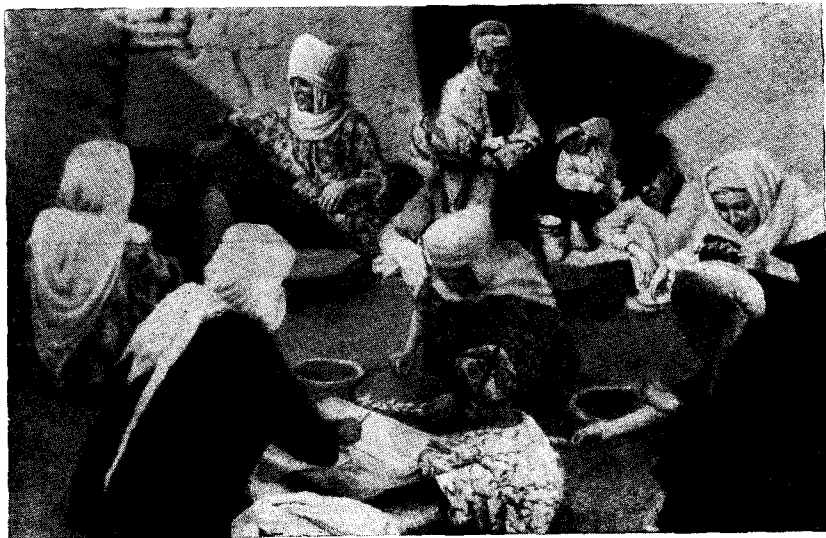
Рис. 6. Женщины готовят ритуальное печенье «баурсак» около могилы «святого» (гор. Ханки)

Упомянутые пережитки и многие другие, на которых мы сейчас не останавливаемся, коренятся в быту женщин по ряду причин. Немалое значение здесь имеют известная культурная отсталость женской части населения и недостаточность культурно-воспитательной работы в этой среде. Однако основную причину следует искать в исторически сложившейся изоляции женского быта, следы которой мы находим и посейчас,