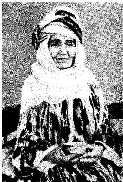
Рис. 7. «Ходым» в церемониальной одежде (гор. Ханки)

Элаты следует рассматривать как реликтовую форму сельской общины, которая в условиях Средней Азии сохраняла в прошлом архаические черты, восходящие к древним родовым традициям.