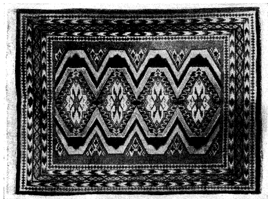
Рис. 2. Шерстяной ворсовый ковер с новым узором; выткан в артели им. Т. Г. Шевченко, г. Косов Станиславской обл. в 1953 г.

Украины, ковры были предметом домашнего убранства не только в панских домах, но нередко и в казацких хатах. В фондах Государственного музея этнографии (Ленинград) имеются украинские ковры, давность