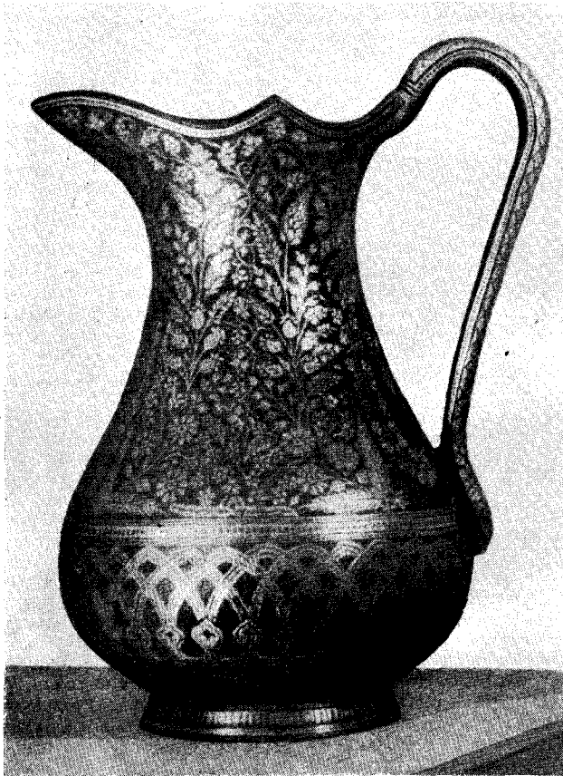
Рис. 1. Кувшин, изготовленный способом «бидри» (г. Бидар, Хайдарабад)

Металлическое ремесло глубоко вошло в быт индийского народа. В каждом крестьянском доме можно встретить, как обязательную принадлежность домашней утвари, медную и латунную посуду. Из меди и латуни изготавливаются разнообразные предметы — от огромных сосудов для воды до крохотных стаканчиков и дешевых женских украшений.