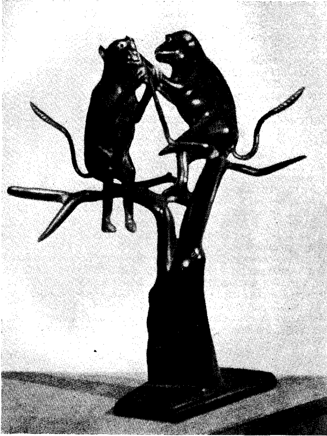
Рис. 5. Обезьяны. Изделие из рога

Большим разнообразием отличаются индийские вышивки. На выставке были экспонированы вышивки по шелковой, шерстяной и хлопчатобумажной ткани, а также вышитые кожаные и бархатные изделия. Превосходные образцы вышивок прислали на выставку ремесленники Кашмира, Пенджаба, Карнатака, Траванкура, Андхры, Уттар Прадеша и других районов Индии.