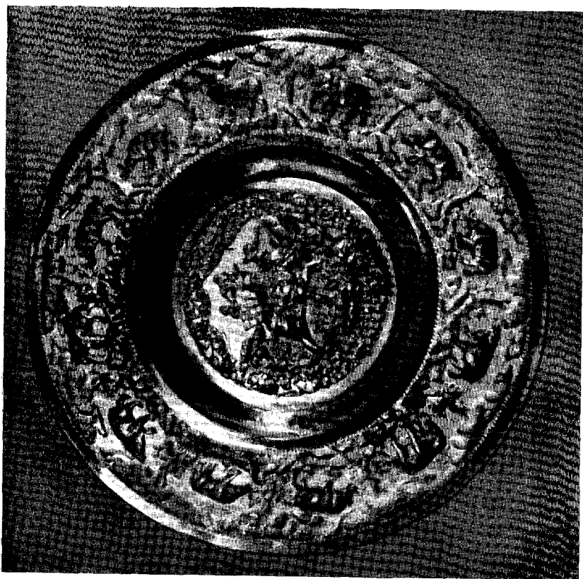
Рис. 2. Блюдо. Рельефная чеканка из Бенгалии