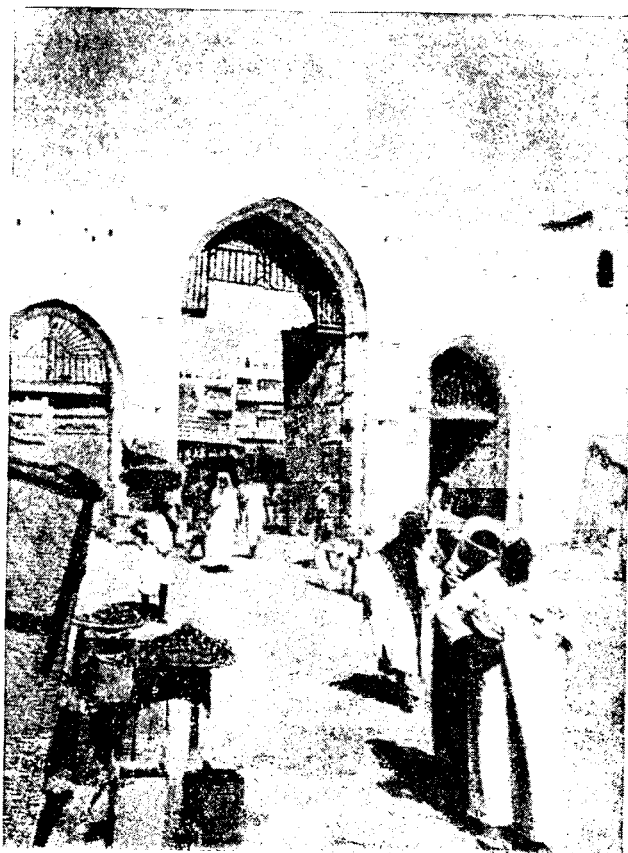
Рис. 1. Улица и ворота в Джидде