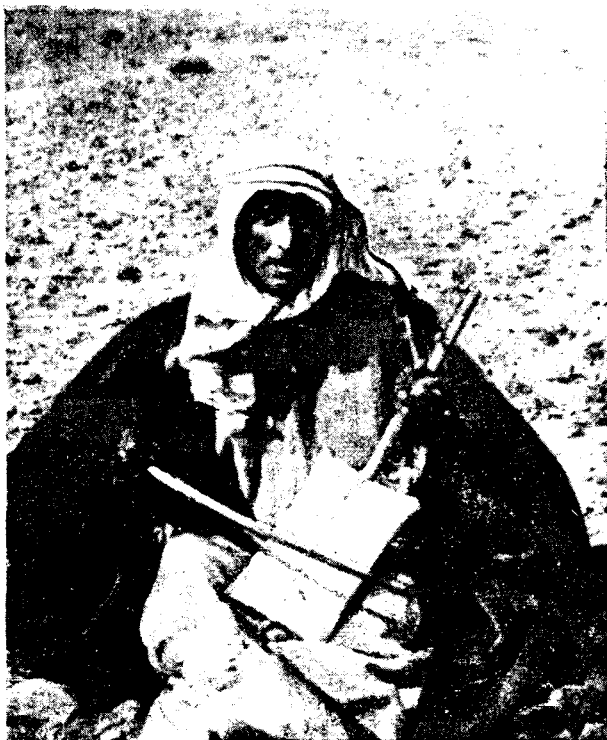
Рис. 3. Странствующий певец

За последнее время правительство Саудовской Аравии провело ряд полезных мер, направленных на подъем экономики и культуры страны. Достигнуты некоторые результаты в области развития народного хозяй-