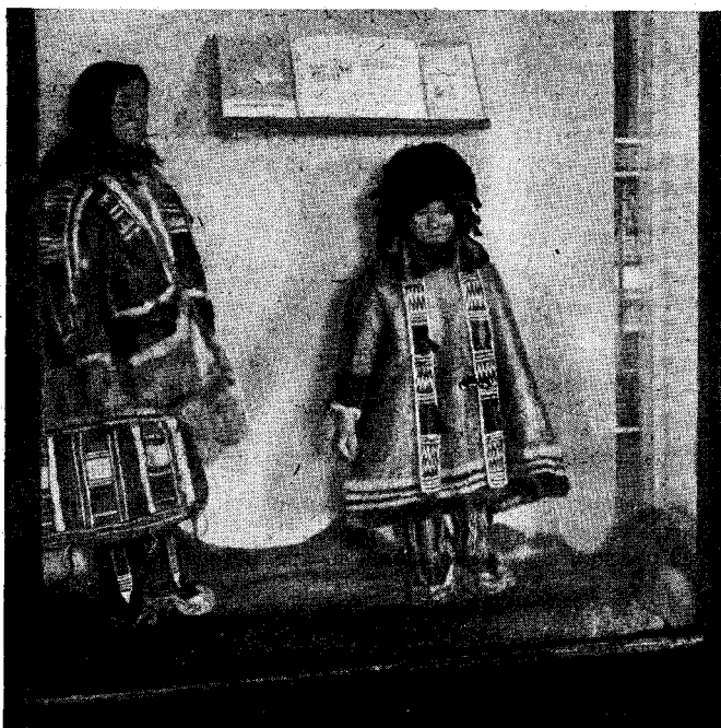
Рис. 1. Народное образование у ненцев. Деталь экспозиции