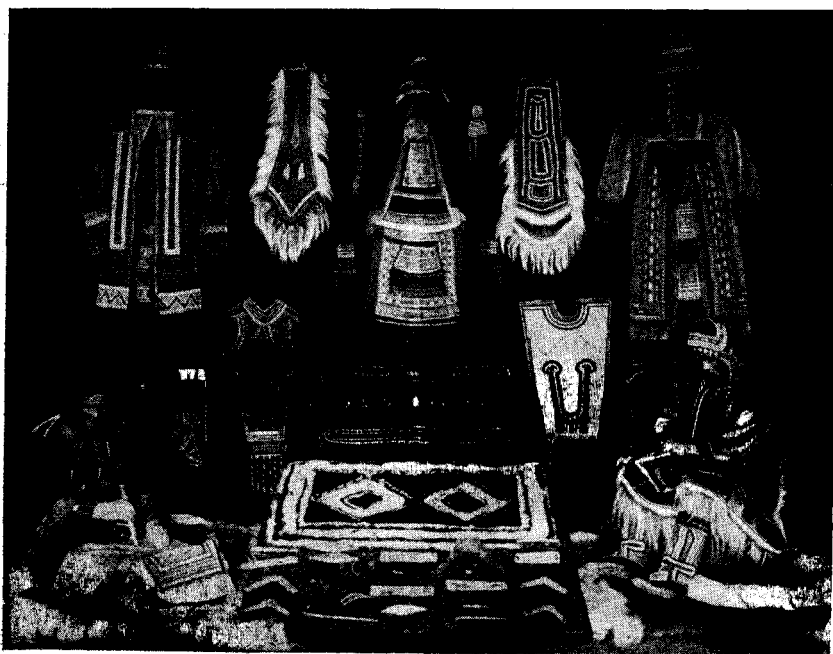
Рис. 4. Искусство эвенков. Деталь экспозиции