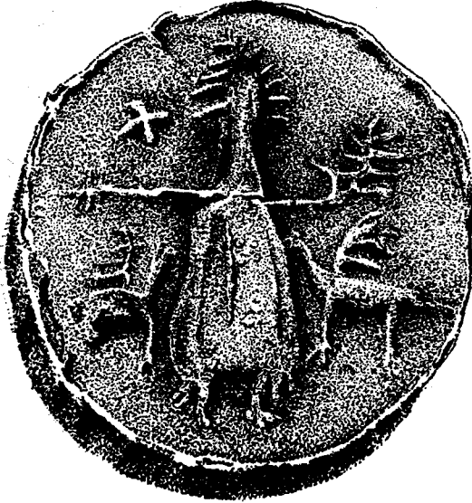
Рис. 3. Оттиск глиняного штемполя III в. н. э. с изображением богини, двух крылатых грифонов и птицы (по В. Ф. Гайдукевичу, 1951).

При сравнительно нечеткой персонификации скифской религии образ древа жизни в большой степени слился с образом змееногой богини, который в свою очередь был аспектом «Владычицы зверо-рей», Великой богини. Большинство современных авторов считает возможным сопоставить змеено-ую богиню с египетской, полуженщиной-полузмеей, о которой много и подробно говорит Геродот 33 .