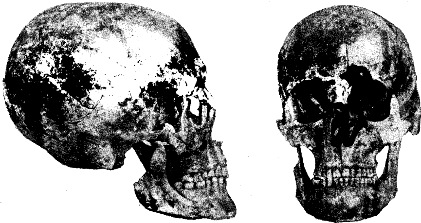
Рис. 1. Череп, обнаруженный на жертвеннике в святилище (после реставрации): а — вид сбоку; б — вид с лицевой стороны;

Чрезвычайно трудно подыскать аналогии только что рассмотренному замечательному памятнику. Однако нельзя не отметить, что среди могил, открытых в составе некрополя Танаиса, имеются две могилы, в которых были лежащие отдельно человеческие черепа. Одна из этих могил была открыта казаком Смычковым в 1907 г. Ввиду того, что вещи из этой могилы были в свое время проданы коллекционеру Романовичу и пропали, приходится оперировать официальным описанием, которое приводится начальником войска Донского 5 . Т. Н. Книпович, подробно рассматривающая вопросы, связанные с некрополем Танаиса, отмечает, что разобраться в этом описании очень трудно 6 . Говорится в описании следующее: «...установлено, что ...казаки... Алексей Смычков и ...Алексей Куприянов Максимов, ломая камень на балке