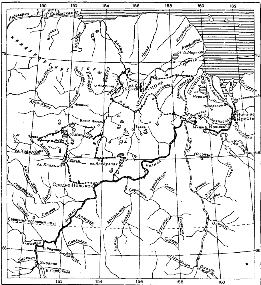
Маршрут Колымского этнографического отряда

Значительную этническую группу в Нижне-Колымском районе составляют чукчи. В Большую или Халерчинскую тундру чукчи проникли лишь в середине прошлого столетия. В 1850—1852 гг. группа чукчей со своими стадами подкочевала к р. Колыме.