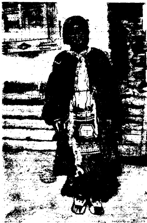
Рис. 2. Эвенская женская одежда

Русские старожилы сохранили множество особенностей в говоре: «сюсюканье», пристрастие к уменьшительным, ласкательным и уничижительным формам. В словаре колымчан сохранилось много древнерусских слов; в то же время в их словарный фонд проникло большое количество слов, заимствованных от коренного населения. Старички-колымчане еще помнят обрывки былин, которые не рассказывают, а поют.