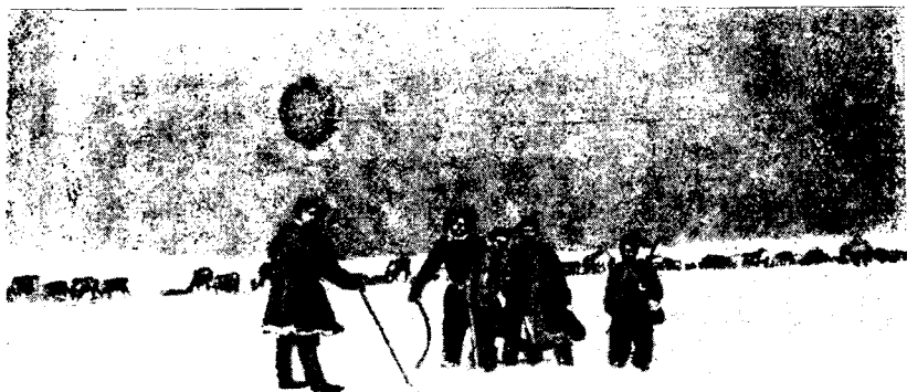
Рис. 1. Пастушеская бригада одного из стад колхоза «Сутаня ударан» (Нижне-Колымский район)

Большинство чукчей обитает в тундре, занимаясь выпасом оленей, охотой и рыболовством. В поселках живут сотрудники управленческого аппарата колхозов, престарелые чукчи и молодежь школьного возраста. Лишь летом опытные старики-эневоды выезжают в стада для руководства перегоном скота, а молодежь и остальная часть престарелых отправляется на рыболовные участки.